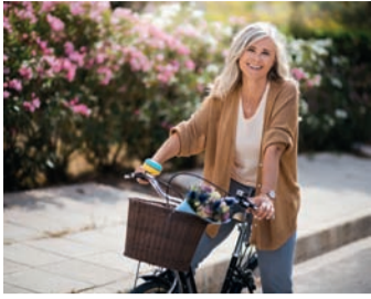
Bewegung macht nicht nur Spaß, sie stärkt auch die Knochen.

Circa 6,3 Millionen Menschen – zu meist Frauen, aber auch rund 1,1 Millionen Männer – sind von Osteoporose betroffen 1 . Die Erkrankung wird oft erst erkannt, wenn es aus einem geringfügigen Anlass zu einem Knochenbruch kommt. Ist die Diagnose gestellt, wird nur jeder Fünfte angemessen behandelt 1 . Eine aktive Lebensweise und eine kalziumreiche Ernährung tragen zudem sowohl dazu bei, einer Osteoporose vorzubeugen als auch eine Behandlung der Erkrankung zu unterstützen.