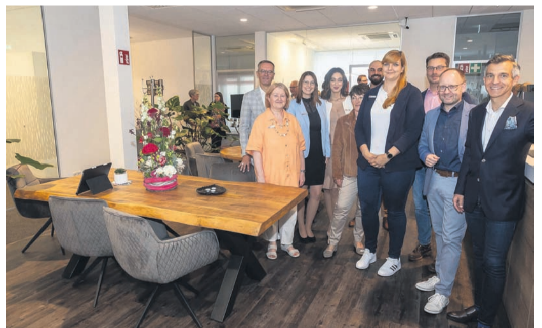
In neuem Glanz: das Beratungszentrum in der Frankfurter Straße.

sieht man ein Reh, kann dem Abendgesang der Nachtigall lauschen oder dem Storch beim Abendspaziergang zusehen. Die Wanderung startet um 19 Uhr (Dauer rund zwei Stunden) am Wasserturm in Jügesheim und endet auch dort. Teilnehmen kann Jedermann, auch Kinder sind willkommen. Die Strecke führt über Wald- und Wiesenwege, ist eben und kann mit leichten Wanderschuhen gut bewältigt werden. Fernglas und Fotoapparat sollten beim „Naturgucken“ immer dabei sein. Eine Anmeldung ist nicht erforderlich. Bei Regen fällt die Wanderung aber aus.