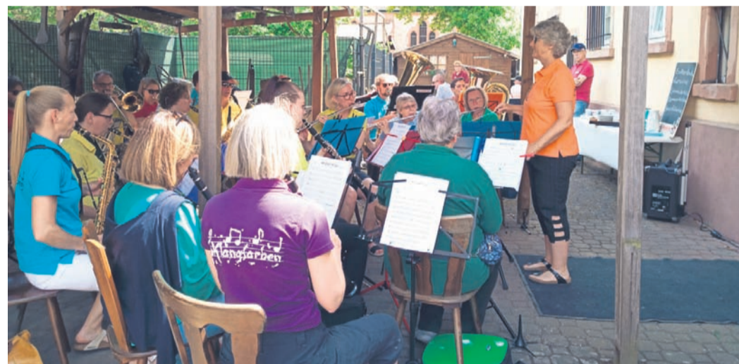
Gute Unterhaltung war im Museumshof geboten.