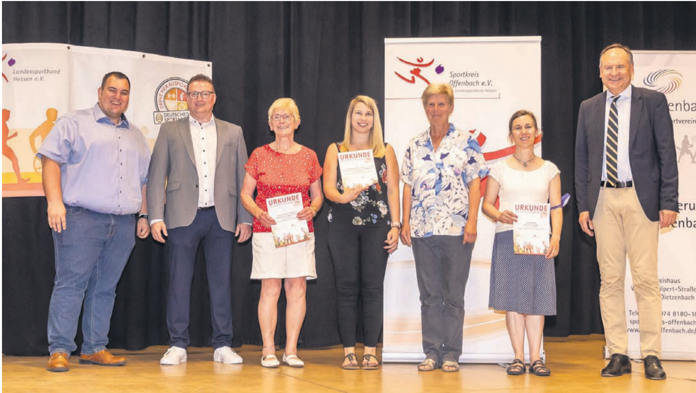
Ehrungen der Familien-Sportabzeichen.