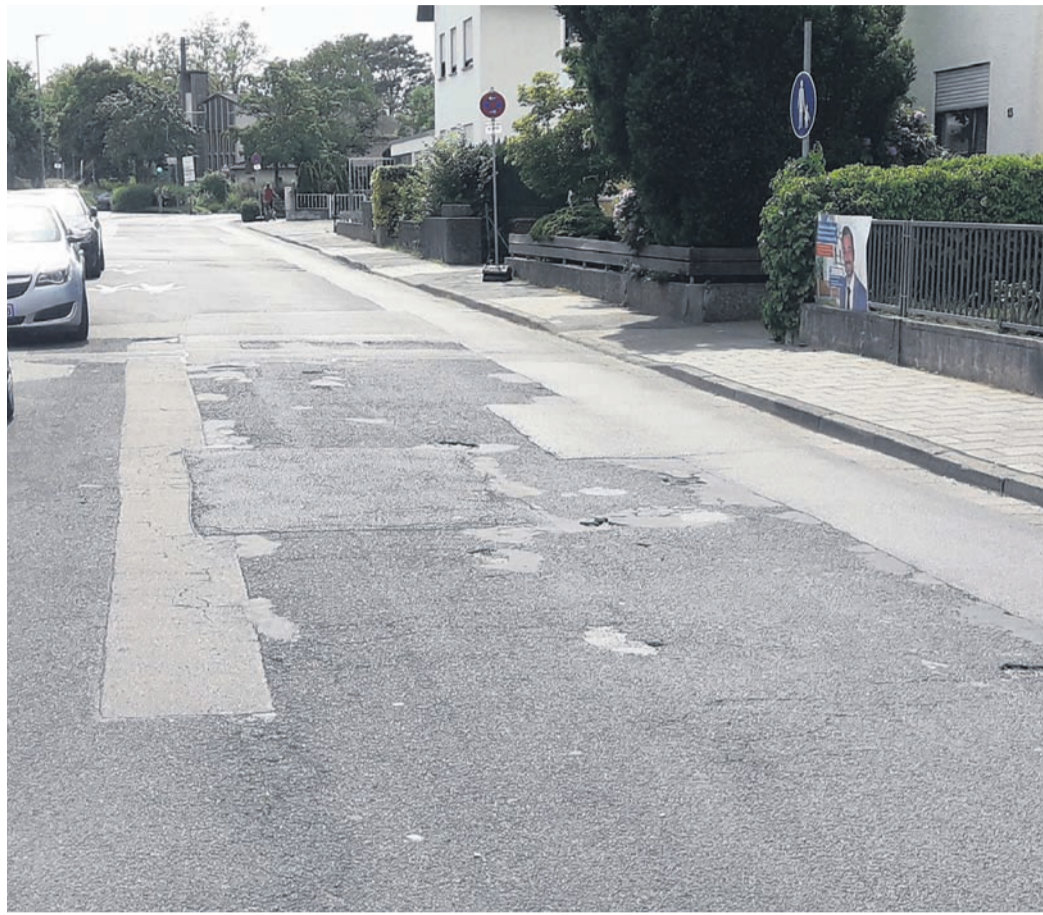
Am vergangenen Montag begann die Straßensanierung der Friedhofstraße im Stadtteil Obertshausen. Dann wird die Straße über die komplette Länge voll gesperrt. Für Durchgangsverkehr und auch Fußgänger müssen dann der Umleitung folgen.

Was wird genau gemacht im Zuge des Straßenbaus? Beidseitig erneuern Fachleute den Gehweg, die Fahrbahn wird erneuert sowie der Bereich mit markierten Stellplätzen versehen. Außerdem entstehen bei