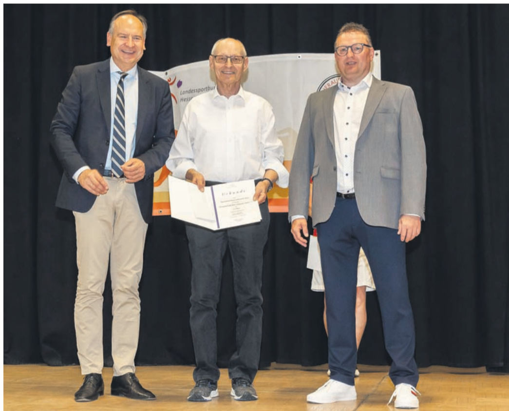
Die Turngemeinde Obertshausen holte den dritten Platz mit 187 Abnahmen.

Insgesamt wurden vergangenes Jahr im Sportkreis Offenbach 2.030 Sportabzeichen verliehen. Das sind zwölf Prozent mehr als ein Jahr zuvor. Hessenweit liegt der Sportkreis Offenbach damit auf Platz fünf, was die Anzahl der verliehenen Sportabzeichen betrifft. Der MTV Urberach ist mit 505 Abnahmen des Sportabzeichens Spitzenreiter bei den Vereinen. Den zweiten Platz konnte sich die Turnerschaft Ober-Roden mit 206 Abnahmen sichern, gefolgt von der Turngemeinde Obertshausen mit insgesamt 187 Abnahmen. Den vierten und fünften Platz erreichten die Sport- und Sänger-Gemeinschaft Langen mit 170 Abnahmen und die TG Hausen (122 Abnahmen). Alle fünf Vereine erhielten je einen Scheck und eine Urkunde. Im Kreis Offenbach sind rund