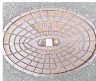
Ein Unterflurhydrant auf der Straße.

Zufahrtswege und Unterflurhydranten nicht zuparken