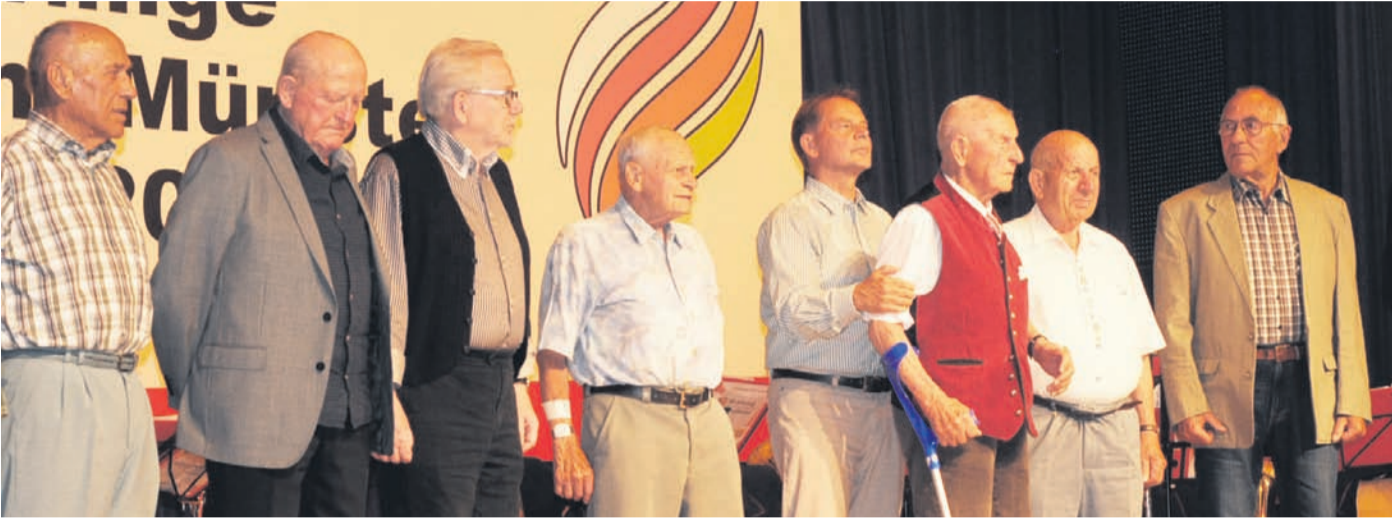
Die Ehrungen für 50 und 60 Jahre fördernde Mitgliedschaft füllten die Bühne der Kulturhalle.

Jubiläums- und Ehrungsabend bei der Freiwilligen Feuerwehr Münster