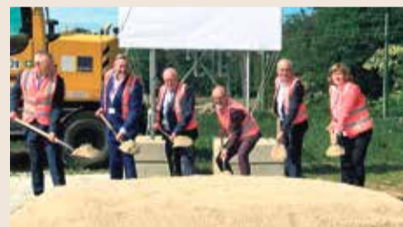
Wirtschaftsminister Tarek Al-Wazir beim symbolischen Spatenstich mit den Verantwortlichen des RMV, der DB Netz AG u. der Städte Offenbach u. Frankfurt.

Milliarde Euro. Ein Großteil davon wird vom Bund getragen, ein wesentlicher Teil auch vom Land Hessen und den Rest steuern die Kommunen bei. Kofinanziert wird das Projekt außerdem mit 20 Millionen Euro durch die Europäische Union. Ziel ist neben der Erweiterung des Mobilitätsangebots die Entlastung des Frankfurter Hauptbahnhofs. Pendler sollen in Zukunft stressfreier die Bahn nutzen können. Die Planung der Regionaltangente West hatte über 15 Jahre gedauert, da bei dem Bauvorhaben verschiedene Interessen unter einen Hut gebracht werden mussten und für jeden einzelnen Schritt Beschlüsse notwendig waren.