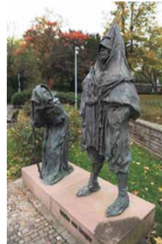
Der Schelm von Bergen findet heute seinen Platz in Form von Kunst in Bergen-Enkheim.

Im Festzelt des Berger Marktes wird in jedem Jahr die Apfelweinkönigin gekrönt. Die neue Hoheit wird kurz nach Eröffnung des Markttreibens durch den Ortsvorsteher gekürt. Die Aufgaben der Königin sind breitgefächert, die Wichtigste davon jedoch, ihren Stadtteil Bergen-Enkheim und das Frankfurter Nationalgetränk Apfelwein für den örtlichen Verkehrsverein zu repräsentieren. Auch muss die amtierende Königin einen Apfelbaum pflanzen, damit auch zukünftig viel Apfelwein gekeltert werden kann. Doch Apfelweinkönigin kann nicht jede werden: In einem Wettkampf mit anderen Frauen muss sie zeigen, dass sie würdig ist, die Krone zu tragen.