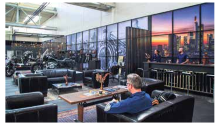
Die BMW-Motorrad-Erlebniswelt steht mit seinem Team für das Sommerfest am 4. Juni in den Startlöchern.