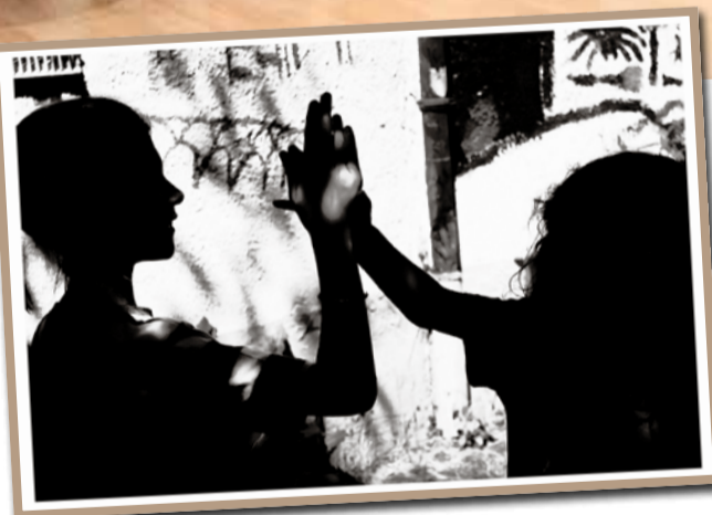
Deutscher Fotojugendpreis Schülerladen Budenzauber.