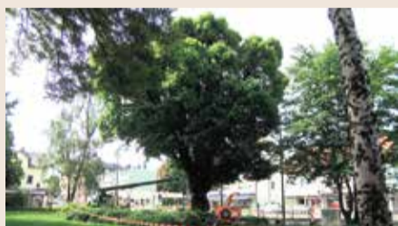
Winterlinde an der Eschersheimer U-Bahn-Station „Lindenbaum“.

Sie prägen das Frankfurter Stadtbild mehr als alle Hochhäuser zusammen – Bäume. Und davon gibt es in der Mainmetropole jede Menge. Rund 238 000 Bäume weist das Baumkataster des Grünflächenamts für das Stadtgebiet aus – ohne Bäume auf Privatgelände und unseren Stadtwald. Die Zahl der Bäume dort dürfte in die Millionen gehen. Der älteste Baum Frankfurts steht tatsächlich im Stadtwald und gehört zu den Schwanheimer Alteichen. Er ist bekannt als Schwanheimer Zwielseiche, hat gut 600 Jahre auf dem Buckel. Nicht weniger beeindruckend ist aber eine Linde in Eschersheim. Der 25 Meter hohe und über 300 Jahre alte Baum bekam nun aus Sicherheitsgründen einen Kronenschnitt verpasst. Ein aufwändiges Unterfangen.