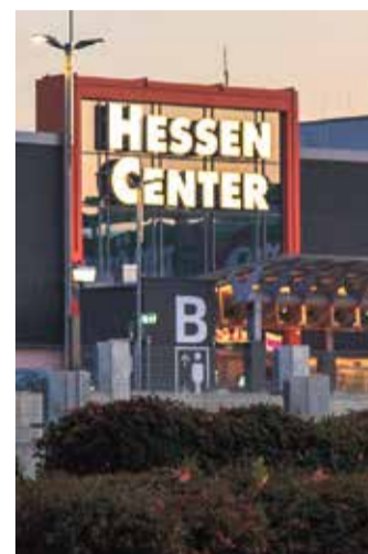
Das Hessen-Center bietet mit 115 Shops eine vielfältige Auswahl an.

Das Hessen-Center ist ein Einkaufszentrum mit einer Verkaufsfläche von knapp 39.000 Quadratmetern. In dem dreigeschossigen Zentrum finden sich rund 115 Shops. Die Anordnung der Shops ist auf die Region zugeschnitten und bietet somit einen vielfältigen Branchenmix von großen Bekleidungs- und Modengeschäften, kleinen Boutiquen sowie eine breite Auswahl an diversen Fachgeschäften. Wer beim Shoppen Hunger bekommt, kann sich im Hessen-Center über eine Vielzahl Cafés und Restaurants erfreuen. Durch die gute infrastrukturelle Anbindung ist es mit Bus, Bahn und Auto leicht zu erreichen.