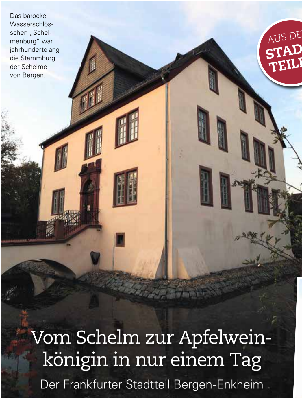
Das barocke Wasserschloss „Schelmenburg“ war jahrhundertlang die Stammburg der Schelme von Bergen.