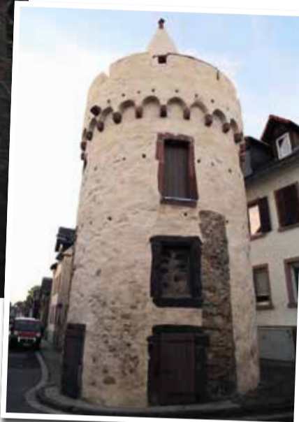
Der Weiße Turm ist eines der Wahrzeichen Bergen-Enkheims.

BERGEN-ENKHEIM (TL/BT) | Bergen-Enkheim gehört zu einem der neueren Stadtteile Frankfurts, denn er wurde erst 1977 eingemeindet. Bereits davor hat sich in Bergen und Enkheim viel getan. Von der eigenen Stadtmauer, dem historischen Rathaus bis zum Hessen-Center ist einiges passiert. Doch die Häuser im Fachwerkstil sind heute noch Teil dieses Stadtteils.