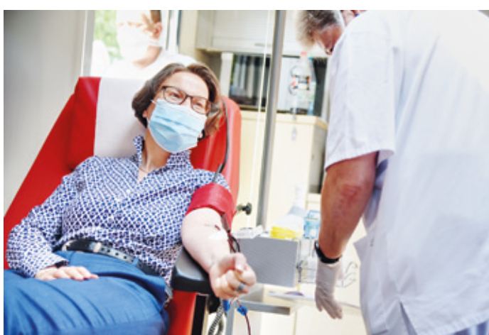
Blutspender/innen sind Lebensretter/innen.

Jede/r wird derzeit gebraucht! Das DRK bittet alle Spendewilligen sich in den nächsten Tagen einen Termin zur Blutspende einzuplanen. Zusammen mit dem DRK-Erzhausen wird Ihnen am Freitag, den 17.06.2022, in der Zeit von 15:30 Uhr bis 19:30 Uhr im Bürgerhaus Erzhausen (Rodenseestr. 5) die Möglichkeit zur Blutspende gegeben. Als Dankeschön erhält jede/r Spender/in eine exklusive DRK-Grillzange. Auf jede/n Erstspender/in