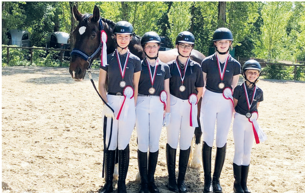
Die Jugendcup-Mannschaft des Reitvereins Arheilgen konnte sich für das Finale qualifizieren.

(SJ) Groß war die Spannung beim Regional-Finale des Jugendcup 2022: Beim Entscheidungsturnier, das am 22. Mai in Kriftel stattfand, kam die Mannschaft des Reit- und Fahrvereins Darmstadt-Arheilgen auf den dritten Platz. Die Entscheidung fiel sehr knapp aus. Nur zwei Punkte fehlten dem jungen Team zum Sieg, nur ein Punkt, um Platz zwei zu belegen. Für die Teilnahme am Finale hatte sich die Arheilger-Mannschaft in den vergangenen Wochen bei Turnieren im Kreis qualifiziert. Am Jugendcup der Pferdesport-Regional-Verbände Kurhessen-Waldeck und Hessen-Nassau dürfen nur Jugendliche teilnehmen, die im laufenden Kalenderjahr höchstens 14 Jahre alt werden. Eine Mannschaft setzt sich aus je vier jungen Reitern zusammen. Die Anforderungen sind dressurmäßiges Reiten entsprechend den Anforderungen eines Reiterwettbewerbs unter besonderer Berücksichtigung von Sitz (Losgelassenheit und Balance) und Einwirkung des Reiters. Außerdem muss eine Theorieprüfung absolviert