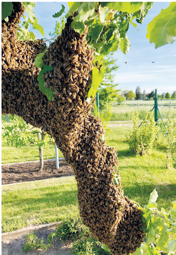
Foto eines Bienenschwarms, der ausgebüxt war und sich im Obst- und Gartenbauverein niedergelassen hatte – er wurde zeitnah wieder eingefangen.