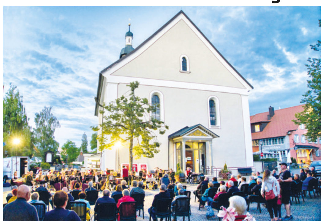
Abendkonzerte in Scheidegg.

Liebe Erzhäuser*innen, Traditionen, wie die sommerlichen Kurzkonzerte in Scheidegg, werden von Gästen und Einheimischen gerne wahrge-