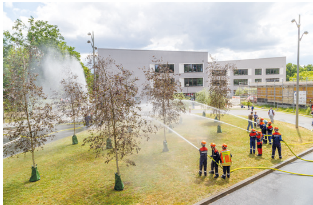
Bericht + Bild: Feuerwehr der Stadt Weiterstadt.

(Weiterstadt) Am Samstag, 28.05.2022, fand nach drei Jahren coronabedingter Pause wieder die Jahresaufaktübung der Jugendfeuerwehren des Bezirk VI statt, die in diesem Jahr von der Feuerwehr Gräfenhausen rund um die Hessenwaldschule ausgerichtet wurde. Angenommen war ein großflächiger Waldbrand, der auf die angrenzenden Gebäude der Schule überzugreifen drohte, die glücklicherweise