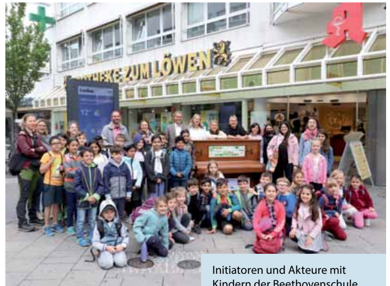
Initiatoren und Akteure mit Kindern der Beethovenschule beim Auftakt der Aktion Spiel mich! – OF Klaviere.

„Ob groß oder klein, Laie oder Profi – jeder darf mitmachen und in die Tasten greifen. Wir wollen Menschen eine weitere Attraktion in der Innenstadt bieten, sie anregen selbst Musik zu machen oder sogar