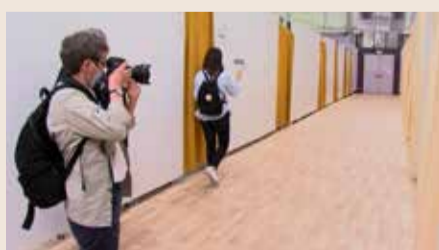
Flüchtlingsunterkunft der Diakonie in einer Turnhalle im Norden Frankfurts

Schätzungsweise 10.000 Geflüchtete sind derzeit in Frankfurt untergebracht. 7.200 davon beziehen Hilfe von der Stadt. Damit hat Frankfurt den größten Anteil hilfsbedürftiger Menschen in Hessen aufgenommen. Wie aber leben die Geflüchteten in der Mainmetropole? Wie sind sie wo untergebracht? In der Notunterkunft der Diakonie in einer Sporthalle im Norden Frankfurts beispielsweise leben aktuell 304 Flüchtlinge, ungefähr die Hälfte davon sind Kinder. Hier gibt es gemeinsame Essensräume, gemeinsame sanitäre Einrichtungen und Privaträume ohne Decke, mit Vorhang als Tür. Medizinische Helfer, Seelsorger, Sozialarbeiter und Übersetzer kümmern sich um die Geflüchteten und sorgen dafür, dass sie benötigte Hilfe erhalten. Die Bewohner sollen nie länger als ein Jahr in einer solchen Notunterkunft verbringen müssen. Die Einstufung mit Hilfe der sogenannten Kaskade entscheidet über das weitere Vorgehen. Die beste Wohnform dabei sind kleine Wohnungen, die beispielsweise vom Deutschen Roten Kreuz gemietet und dann an die Geflüchteten weitergegeben werden, mit Platz für bis zu fünf Personen. Durch den Aufruf zu Beginn des Ukraine-Krieges unter wohnraum@frankfurt-hilft.de konnten rund 100 solcher Wohnungen bereits bezogen werden. Weitere 104 stehen kurz davor.