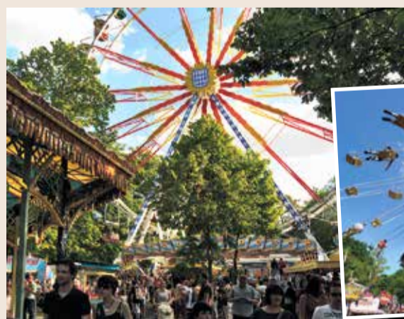
Am Wäldchestag geht der Frankfurter mit Familie in den schönen Stadtwald. Kettenkarussell fahren gehört fest ins Programm.