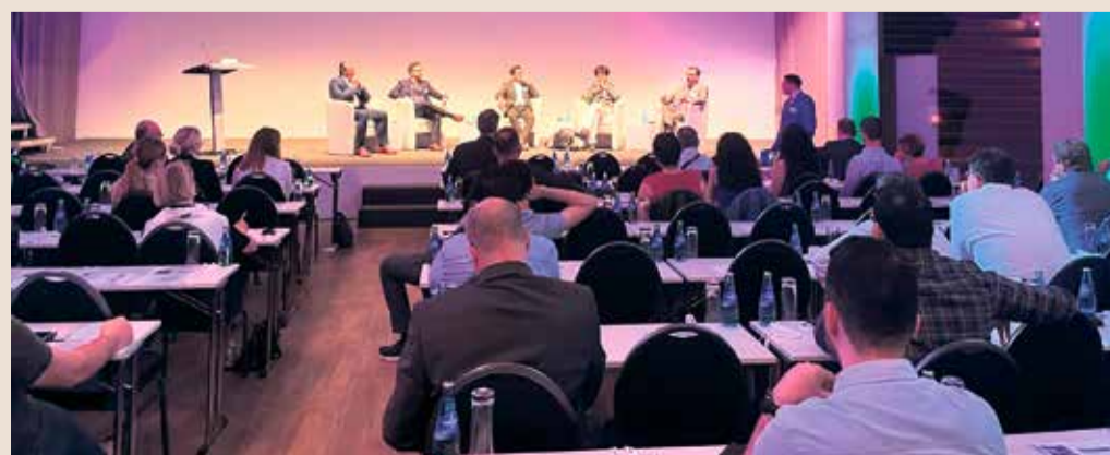
Auf dem Podium wurde rege diskutiert.

Die durchweg positive Bewertung der Fachveranstaltung hat sich schon ausgezahlt – im kommenden Jahr wird die Konferenz in erweitertem Rahmen wieder stattfinden. Prof. Donas plant den Kongress auf 3 Tage auszuweiten, damit noch mehr Themen und Forschungsergebnisse vorgestellt und diskutiert werden können – alle Interessenten sollten sich den 04. – 06. Mai hierfür bereits vormerken.