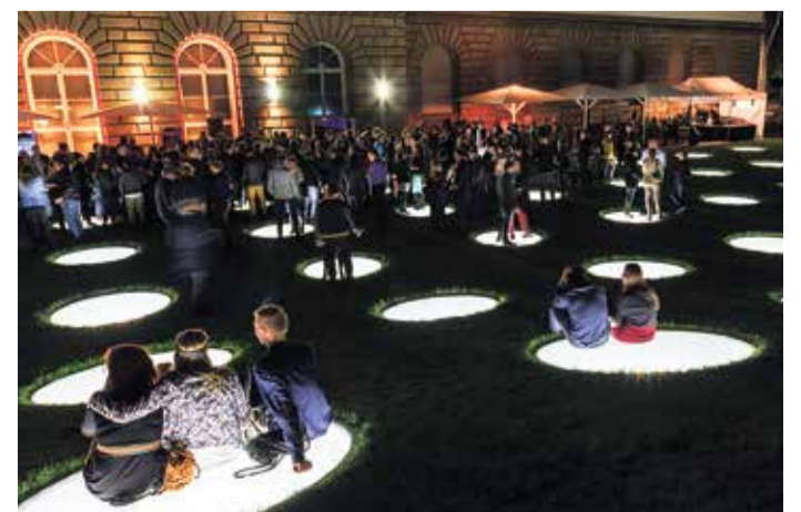
Ausklang mit Party LA FÊTE am 11. Juni.

Unter dem Motto „Au revoir Renoir!“ kann die Ausstellung am letzten Wochenende der Laufzeit am Freitag, dem 17. Juni sowie am Samstag, dem 18. Juni bei verlängerten Öffnungszeiten bis jeweils 22.00 Uhr besucht werden. Die Sommerabende finden im Vorgarten des Museums bei Drinks und Snacks ihren Ausklang.