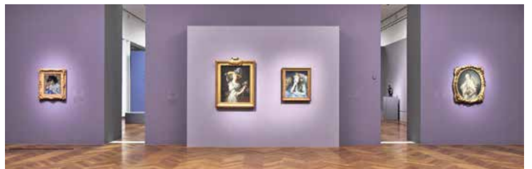
Ein Blick in die Ausstellung im Städel.