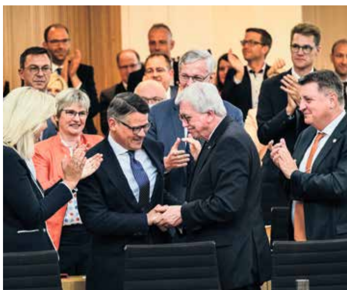
Gratulation von Volker Bouffier zur Wahl des neuen Ministerpräsidenten von Hessen.

WIESBADEN/FRANKFURT (KH) | Gleich im ersten Wahlgang erhielt der in Frankfurt geborene Boris Rhein mehr als die benötigten Stimmen – insgesamt 74 Ja-Stimmen. Dies waren fünf Stimmen mehr als die schwarz-grüne Koalition im Parlament besitzt. Rhein dankte den Abgeordneten für das „überwältigende Vertrauen“. Nach der Wahl im Parlament folgte die offizielle Übergabe des Regierungssitzes durch Volker Bouffier. Im Anschluss kam die Landesregierung zur ersten Kabinettsitzung unter Führung des neuen Ministerpräsidenten zusammen.