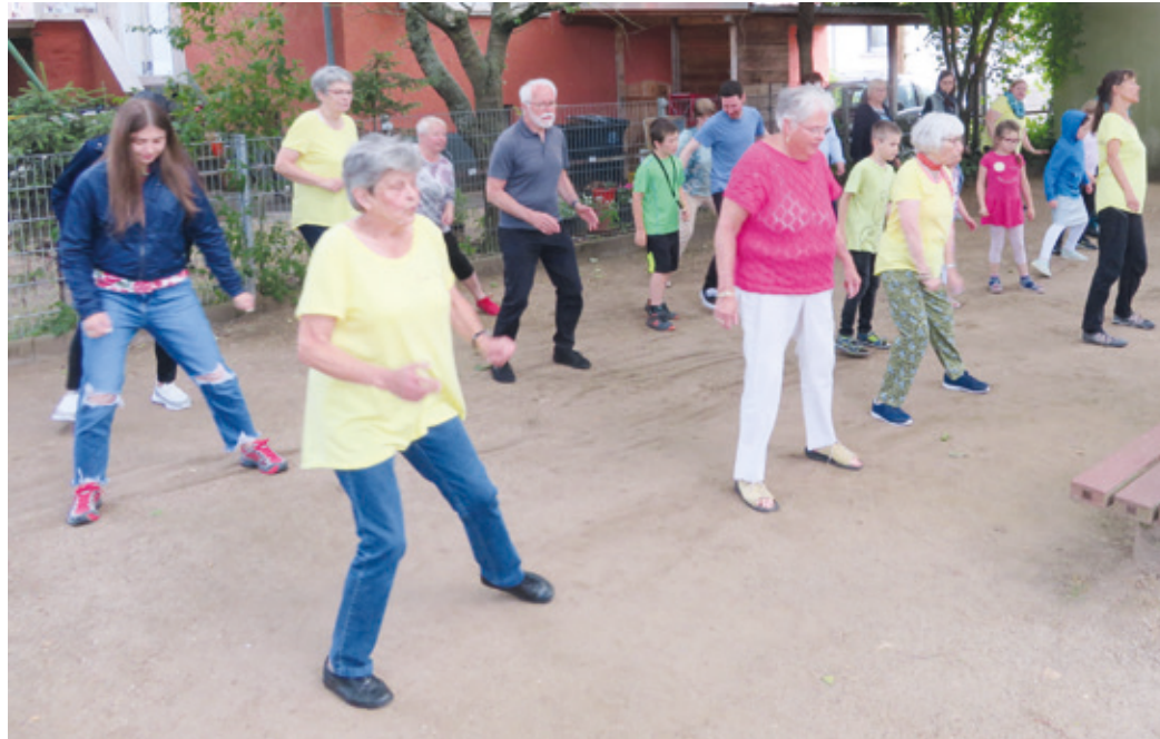
Alt und Jung beim Line Dance.

Line Dance Vorführung der TSG fand großen Anklang