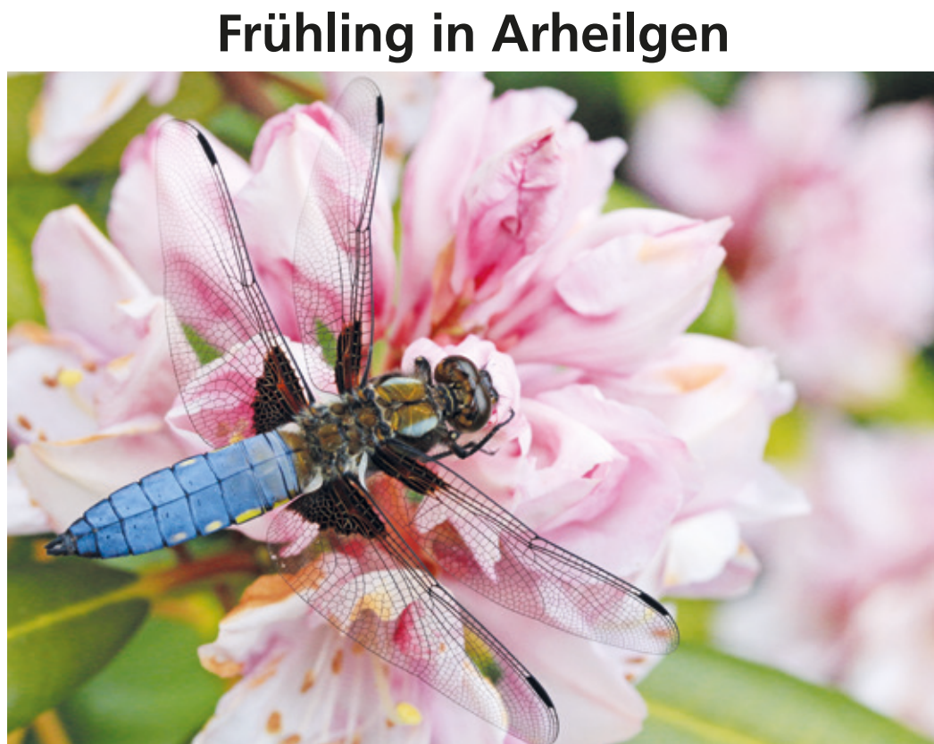
Bei dieser schönen Libelle handelt es sich um einen „Südlichen Blaupfeil“.