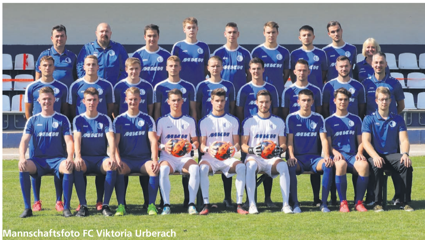
Mannschaftsfoto FC Viktoria Urberach