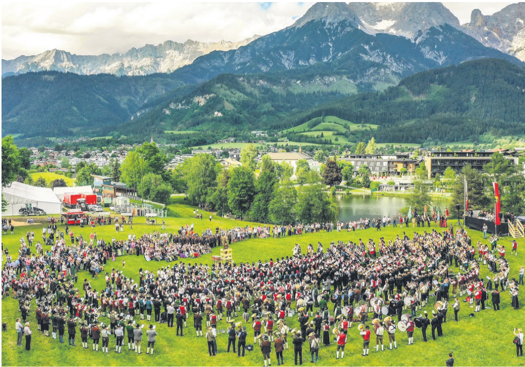
Gemeinschaftskonzert mit 19 Orchestern.

Die Musik mit ihrer verbindenden Kraft stand demzufolge im Mittelpunkt der drei Tage. Und wenn die Rödermärker auch sportlich nicht ganz überzeugen konnten, taten sie dies musikalisch um so mehr. Dafür verantwortlich waren die 30 Musikerinnen und Musiker des Musikvereins 03 Ober-Roden, die die Delegation aus Mitgliedern von Magistrat, Stadtver-