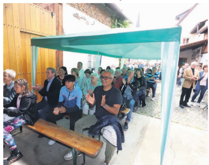
Trotz der unsicheren Wettervorhersage waren viele Besucher in den Dinjerhof gekommen.

Letztlich wurden die Vereine dafür belohnt, die Veranstaltung trotz der unsicheren Wetterprognosen durchzuziehen. Wettertechnisch war die erste Pfingstmusik nämlich eine ziemliche Punktlandung: Nicht allzu lange nach den Auftritten der Orchester begann es stark zu regnen.