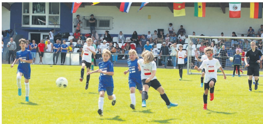
22 Mannschaften nahmen an der Mini-EM bei der Viktoria teil.

Am Pfingstwochenende fand die Mini-EM statt, die aus dem vergangenen Jahr nachgeholt wurde. Vom 16. bis 17. Juli folgt dann im Vorgriff auch die echte Weltmeisterschaft in Katar im Winter die Mini-WM. Die EM wurde von E-Jugend-Teams aus der Region nachgespielt, bei der WM in ein paar Wochen sind dann die F-Jugend-Mannschaften an der Reihe. Natürlich gab es zu Turnierbeginn wieder eine große Eröffnungsfeier, ehe die Vereine in den Trikots ihrer im Vorfeld zugelosten EM-Teilnehmerländer um den Titel kämpften. Nach zwei spannenden Turniertagen standen sich am Pfingstmontag Belgien (Spvgg. 05 Oberrad) und England (Viktoria Griesheim) im Finale gegenüber. Nach regulärer Spielzeit stand es 0:0, im Achtmeterschießen setzten sich die Belgier durch. Auch im Spiel um Platz drei gab es ein Achtmeterschießen, das