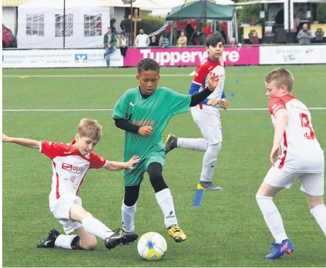
Das Team II der E-Junioren des FV Eppertshausen (rot-weiß) im Turnierspiel gegen Viktoria Klein-Zimmern.

Im Zuge der Siegerehrung der E-Junioren kündigte Helfmann nämlich an, man wolle sich im Eppertshäuser Sportzentrum demnächst noch einmal den beiden Kleinfeldern widmen. Die Bolzplätze sind zwar wie der ehemalige Hartplatz inzwischen in Kunstrasen-Spielfelder umgebaut, im Gegensatz zum Großfeld aber noch nicht optimal mit Flutlicht ausgeleuchtet. Dies trachte man seitens der Gemeinde, der das