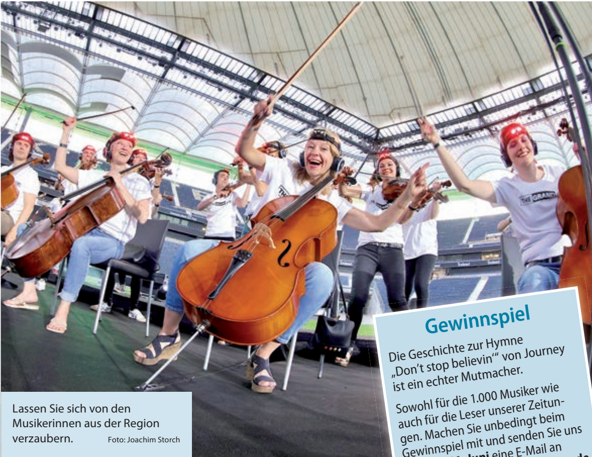
Lassen Sie sich von den Musikerinnen aus der Region verzaubern.