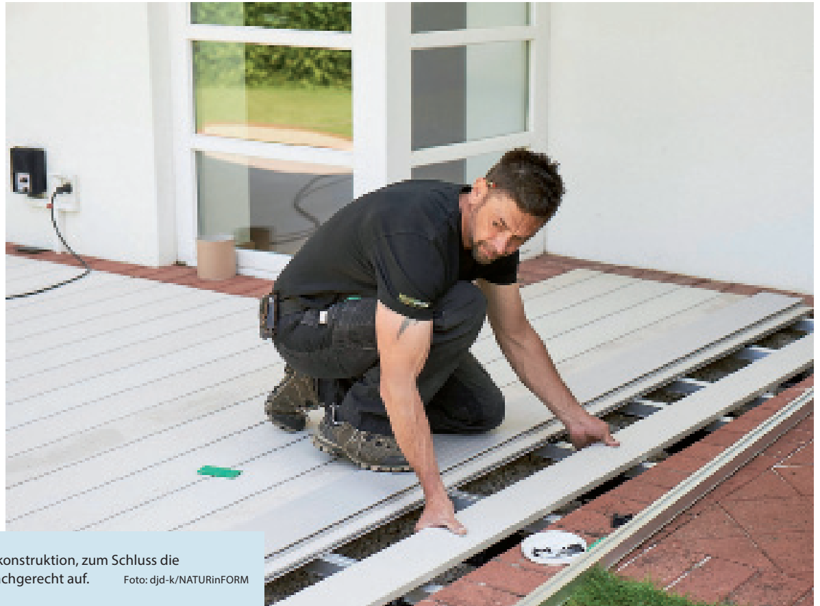
Zuerst ein Schotterbett, dann eine Unterkonstruktion, zum Schluss die WPC-Dielen: So baut man eine Terrasse fachgerecht auf. Foto: djd-k/NATURinFORM

(DJD-K). Terrassenbau in Eigenregie? Für erfahrene Heimwerker kein Problem, mit Terrassendielen aus Holzverbundwerkstoff ist der Aufwand überschaubar. Damit diese sogenannten WPC-Dielen, beispielsweise von Naturinform, lange nutzbar und schön bleiben, brauchen sie einen fachgerecht vorbereiteten Untergrund. Hier ist eine Schotterdecke empfehlenswert, die Regenwasser direkt nach unten ableitet. Zwischen Schotter und Oberbelag sollten mindestens acht Zentimeter Luft bleiben. Das wird durch eine passende, vom Dielenhersteller angebotene Unterkonstruktion aus Profilen und Kunststofffüßen zum Höhenausgleich erreicht. Darauf montiert man schließlich die Dielen. Wie viel Baumaterial benötigt wird, können Heimwerker mithilfe eines kostenlosen Terrassenplaners unter www.naturinform.de ausrechnen.