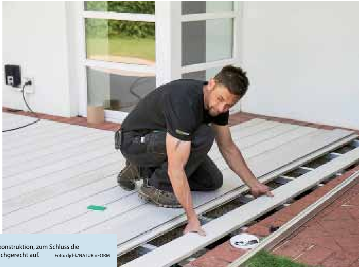
Zuerst ein Schotterbett, dann eine Unterkonstruktion, zum Schluss die WPC-Dielen: So baut man eine Terrasse fachgerecht auf.

(DJD-K). Terrassenbau in Eigenregie? Für erfahrene Heimwerker kein Problem, mit Terrassendielen aus Holzverbundwerkstoff ist der Aufwand überschaubar. Damit diese sogenannten WPC-Dielen, beispielsweise von Naturinform, lange nutzbar und schön bleiben, brauchen sie einen fachgerecht vorbereiteten Untergrund. Hier ist eine Schotterdecke empfehlenswert, die Regenwasser direkt nach unten ableitet. Zwischen Schotter und Oberbelag sollten mindestens acht Zentimeter Luft bleiben. Das wird durch eine passende, vom Dielenhersteller angebotene Unterkonstruktion aus Profilen und Kunststofffüßen zum Höhenausgleich erreicht. Darauf montiert man schließlich die Dielen. Wie viel Baumaterial benötigt wird, können Heimwerker mithilfe eines kostenlosen Terrassenplaners unter www.naturinform.de ausrechnen.