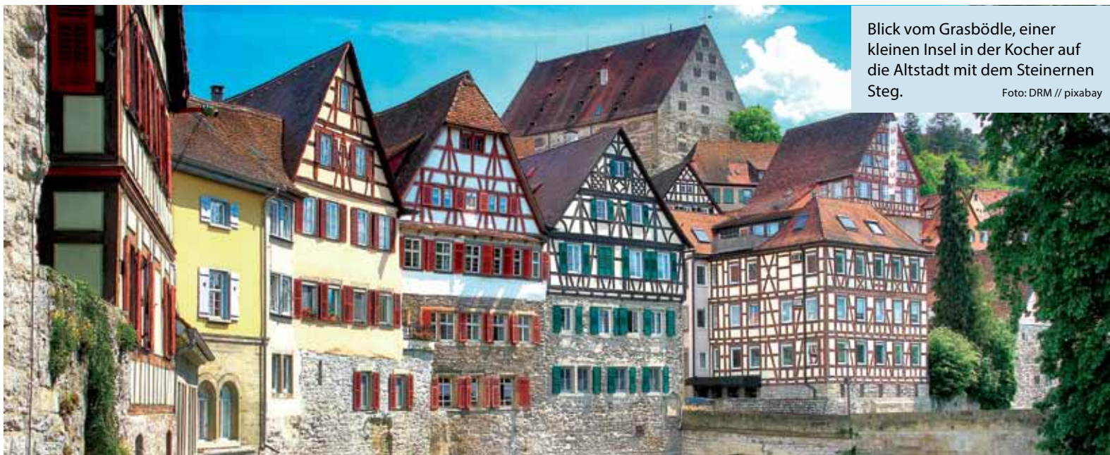
Blick vom Grasbödle, einer kleinen Insel in der Kocher auf die Altstadt mit dem Steinernen Steg.