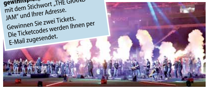
Beeindruckende Showeffekte beim THE GRAND JAM.