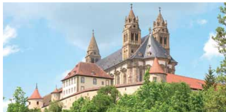
Das ehemalige Kloster Großcomburg wirkt wehrhaft. Der Ursprung des Klosters war eine Burganlage und hat sich den Charakter erhalten.

Etwas südlich von Schwäbisch-Hall liegt ein ehemaliges Benediktinerkloster, welches 1078 gegründet wurde. Die Burgartige Anlage erhebt sich auf einem kleinen Hügel über dem Kocher und ist für Besucher geöffnet. Die meisten Gebäude werden als Schulen genutzt, die Kirchen, Wehrgänge und mehr sind aber zugänglich und ermöglichen einen einmaligen Blick ins Tal der Kocher. Gegenüber liegt mit Kleincomburg die 1108 gestiftete Kirche St. Ägidius.