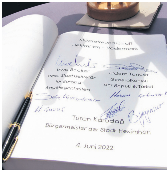
Eintrag ins Goldene Buch.

ter und eine Rödermärer Delegation im Frühjahr 2023 nach Hekimhan reisen, um dort den Ist-Zustand und das Anforderungsprofil rund um das Stichwort „Partnerschaft“ noch einmal gründlich abzuklopfen. Dann werde sich zeigen, ob man gemeinsam den „letzten Schritt“ gehen könne, blickte der Bürgermeister nach vorn. Anschließend, so die nun aufschimmernde Zeitachse, liegt der Ball im Rödermärer Parlament. Die Stadtverordneten werden entscheiden, ob aus der freundschaftlichen Verbundenheit tatsächlich eine offizielle Verschwiegerung mit Urkunde und Siegel wird.