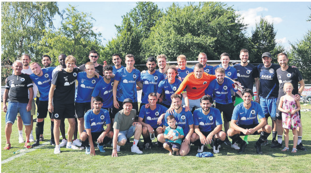
Die erste Mannschaft der Germania steht auf dem sechsten Tabellenplatz mit 54 Punkten in der Verbandsliga Süd.