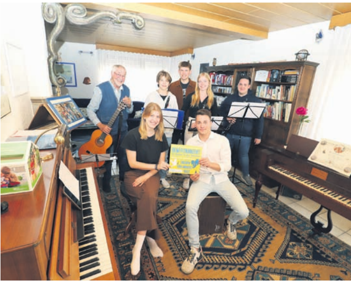
Für das von Reinhold Franz initiierte Benefizkonzert wird derzeit fleißig geprobt.