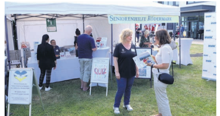
An den Infoständen wurden die Besucher der Seniorenmesse über die vielfältigen Angebote für ältere Menschen in der Stadt informiert.

Im BA-Gebäude beschäftigte sich ein weiterer Vortrag mit der Hospizarbeit der Johanner. Über ihre Arbeit informierten beispielsweise auch die Radioinitiative, die zu einem Quiz einlud, VDK, Seniorenbeirat und Seniorenhilfe.