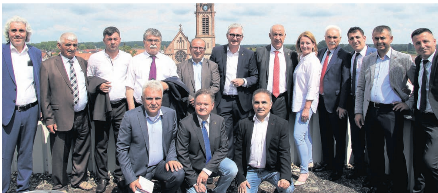
Die Delegation aus Hekimhan und ihre Gastgeber auf dem Rathausdach.