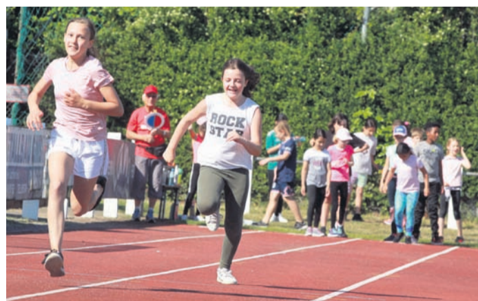
Die vierten Klassen machten den Auftakt zu den Bundesjugendspielen der Trinkbornschule.

Rund 550 Kinder waren auf dem Sportgelände der Turnerschaft, wo die Trinkbornschule seit vielen Jahren ihre Bundesjugendspiele veranstaltet, im Einsatz. Nach einem kurzen Aufwärmprogramm wurde bei schönem Sommerwetter gerannt, gesprungen und geworfen. Am Donnerstag waren die dritten und vierten Klassen sowie die Vorklasse auf dem TS-Sportplatz zu Gast, am Freitag folgten die ersten und zweiten Klassen „Wenn man bedenkt, dass wir bei Mehrkampfmeisterschaften im Kreis meist so 120 Teilnehmer haben, dann ist das hier schon