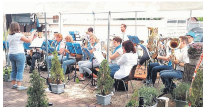
Mit Sonnenschein und bester Laune bot Horsch e-mol(l) ein musikalisches Potpourri aus nahezu 100 Jahren Pogggeschichte zum Tag der offenen Tür der Privilegierten Schützengesellschaft (PSG).

Weitere Infos zu musikalischen Programm und den Teilnehmern gibt es auf der Homepage der IG River Night unter www.rivernight.de .