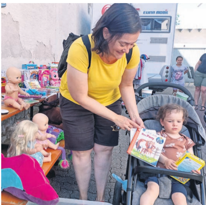
Vor allem Kinderkleidung und Spielsachen waren beim Hofflohmkt gefragt.

Dass sich der Hofflohmkt in Eppertshausen im Gegensatz zu Dieburg hält, mag auch daran liegen, dass die Distanzen weitaus geringer sind und damit die Ermüdungserscheinungen bei den Käufern auf ihrem Weg von Hof zu Hof geringer ausfallen. In Dieburg ging die Bitte raus, aus Umweltschutzgründen und aufgrund des begrenzten Parkraums nicht mit PKWs die Runde zu machen. Die Frage, wie man zu den Teilnehmern eines Hofflohmärts am besten gelangt, wurde am Wochenende in Eppertshausen von einem älteren Ehepaar besonders einfach gelöst: "natürlich zu Fuß. Wir betrachten unsere Teilnahme heute als eine ausgezeichnete Gelegenheit zum Wandern", führten die beiden an. Mit dem Fahrrad wollte man nicht fahren, da sich darauf der Transport erstandener Artikel vielleicht als Problem erweisen könnte. Die Frage, ob dann die Sachen nicht die ganze Zeit mit herumgetragen werden müssen, verneinte das Paar. "Mein Mann bringt das Gekaufte zum abgestellten Auto am Bahnhof. Dann kommt er wieder", lautete die Antwort von weiblicher Seite.