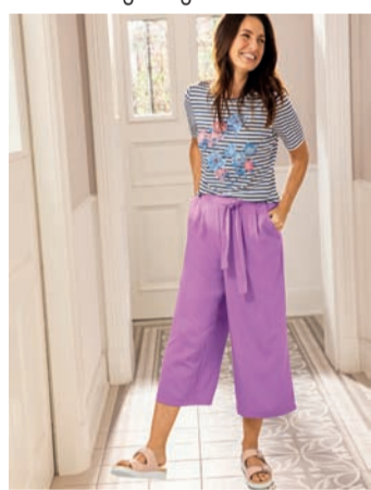
Avena GmbH & Co. KG, Rheingrafenstraße 3, 55543 Bad Kreuznach

Der Sommer lockt mit spannenden Reisezielen bei herrlich warmen Temperaturen. Egal, ob es nach Syllt oder Italien geht - mit diesem pflegeleichten Outfit von Avena macht Frau bei jeder Urlaubsaktivität eine gute Figur!