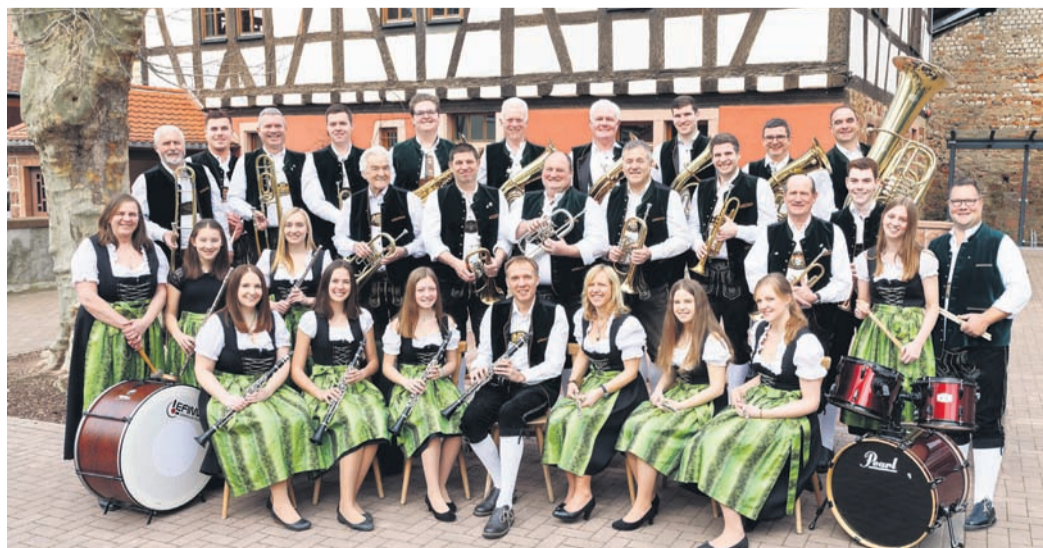
Musik bieten die Gäste aus Großwallstadt bei der Serenade am 14. Juli.