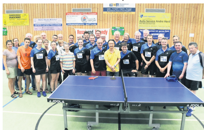
Die Teilnehmer des Revival-Turniers ehemaliger aktiver Tischtennis-Spieler der DJK.