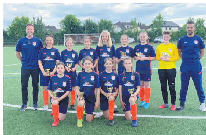
Bei einem Jugendturnier des FV Eppertshausen erreichten die FSV C-Juniorinnen einen guten 8. Platz.

Falls Sie dieses Produkt nicht mehr erhalten möchten, bitten wir Sie, einen Werbeverbot aufkleber mit dem Zusatzhinweis „Keine kostenlosen Zeitungen“ an Ihrem Briefkasten anzubringen. Weitere Informationen finden Sie auf dem Verbraucherportal www.werbung-im-briefkasten.de .