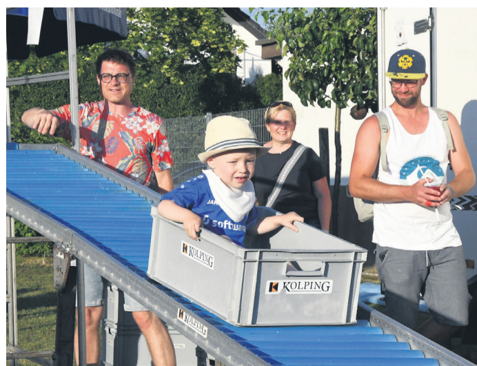
In einem Spielpark hatten auch die jüngsten Besucher ihren Spaß.