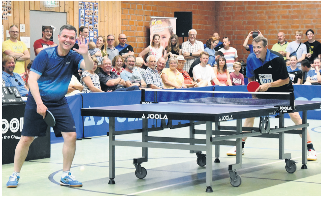
Schabernack: Steffen „Speedy“ Fetzner (l.) grüßt den Fotografen, während Jörg „Rossi“ Roßkopf am Samstagabend in der Münsterer DJK-Halle auf die Angabe wartet.