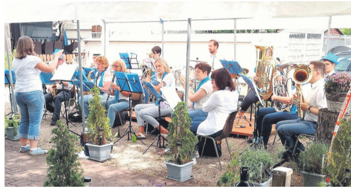
Mit Sonnenschein und bester Laune bot Horsch e-mol(l) ein musikalisches Potpourri aus nahezu 100 Jahren Pogggeschichte zum Tag der offenen Tür der Privilegierten Schützengesellschaft (PSG).

Weitere Infos zu musikalischen Programm und den Teilnehmern gibt es auf der Homepage der IG River Night unter www.rivernight.de .