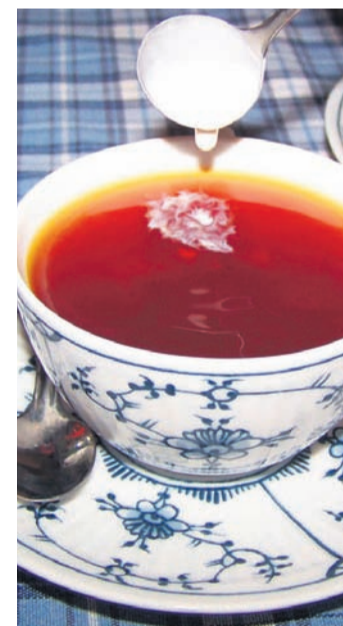
Ein „Wulkje“ aus Sahne gehört zum Ostfriesentee wie Watt und Wellen.

Das Unesco-Weltnaturerbe ist ein einzigartiger Naturraum, der sich zum Teil nur auf vorgegebenen Wegen erkunden lässt, um Tier- und Pflanzen-