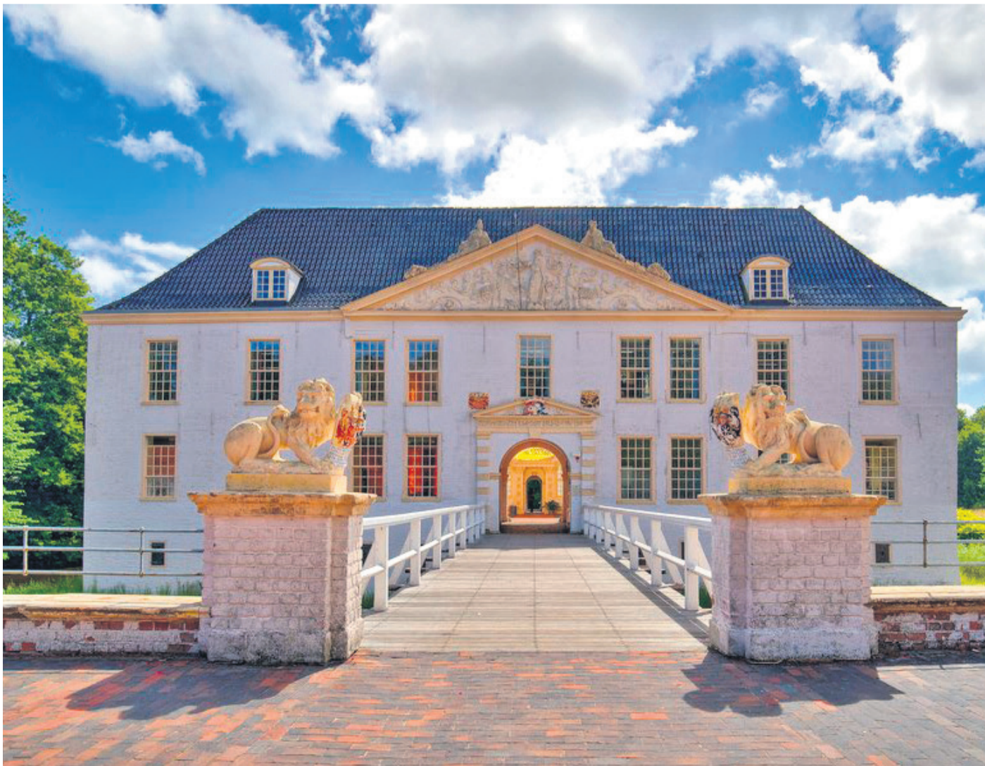
Herrschaftlich glänzt das mittelalterliche Wasserschloss von Dornum.

Was die wenigsten wissen: Hier in Ostfriesland hatten im Mittelalter die Häuptlinge das Sagen. Bis heute zeugen die prächtige Beningaburg und das barocke Wasserschloss von dieser glanzvollen Vergangenheit. Und jedes Jahr im Sommer erinnern die Ritterspiele an die Häuptlinge von damals. Dann wird zehn Tage lang ausgelassen gefeiert – auch ein schönes Geschenk für die Seele.