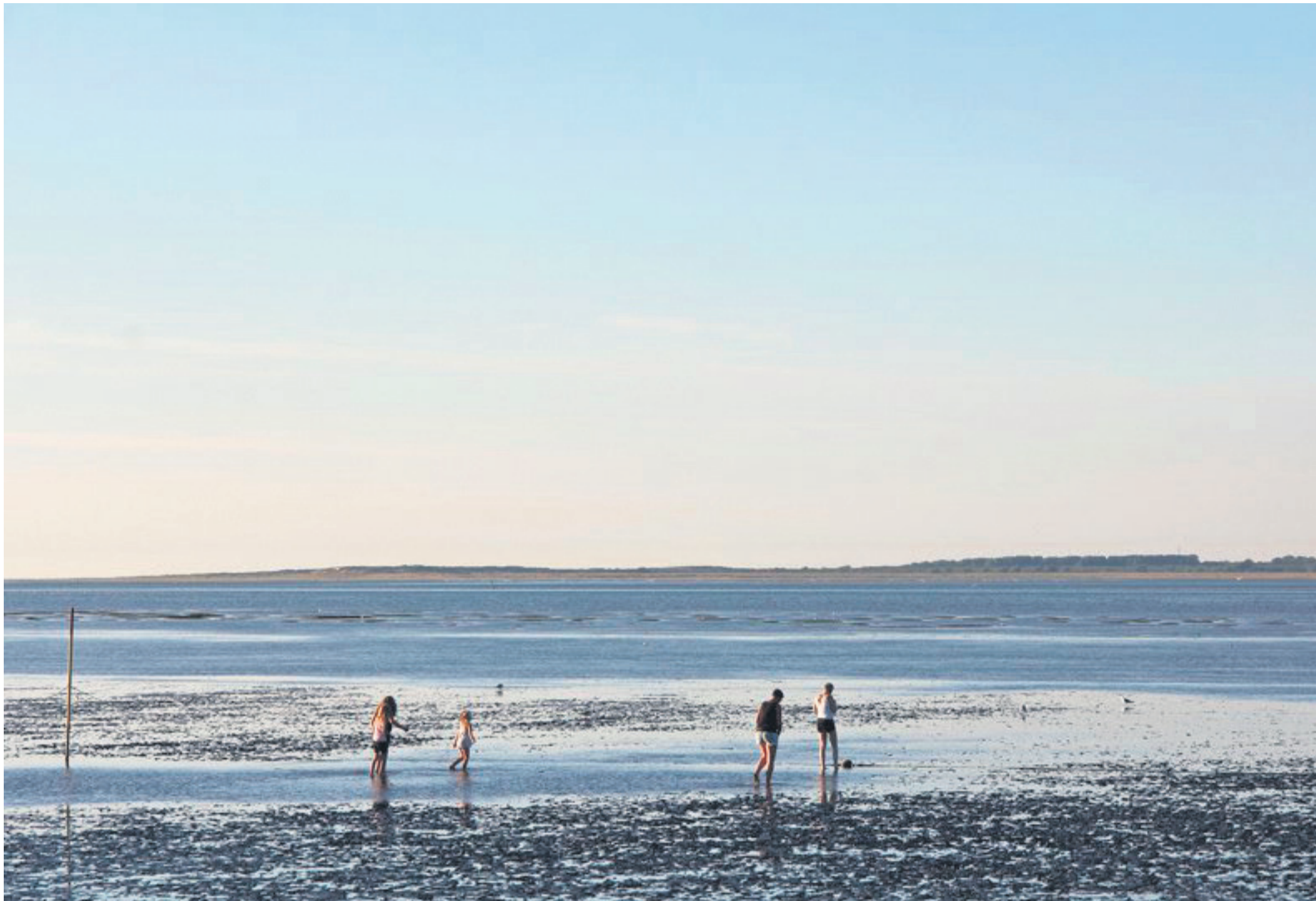
Entschleunigen im Takt der Nordsee: Zwischen Ebbe und Flut schenkt Ostfriesland viel Zeit für Erholung.