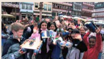
Kinder beim 14. „Frankfurter Solarrennen“ auf dem Römerberg in Frankfurt

Die Kraft der Solarenergie hautnah erleben: Dafür sorgte der Bildungswettbewerb „Frankfurter Solarrennen“ bereits zum 14. Mal. Auf dem Römerberg in Frankfurt traten 600 Schülerinnen und Schüler aus Frankfurt, Hochheim und Rodgau unter dem Motto „Sonne bewegt!“ gegeneinander an. Die Fahrzeuge waren aber nicht nur schnell, sondern sahen auch gut aus. An acht Grundschulen konstruierten Kinder Solarboote. An 16 weiterführenden Schulen entwarfen Jugendliche Solar-Autos. Insgesamt traten beim Solarrennen 80 Boote und 220 Autos an. Und auch wenn nicht jeder zum Sieger gekürt werden konnte: Das Ziel hinter der Kampagne, Kindern und Jugendlichen Solarenergie als eine der möglichen erneuerbaren Energien näher zu bringen, wurde auf jeden Fall erreicht.