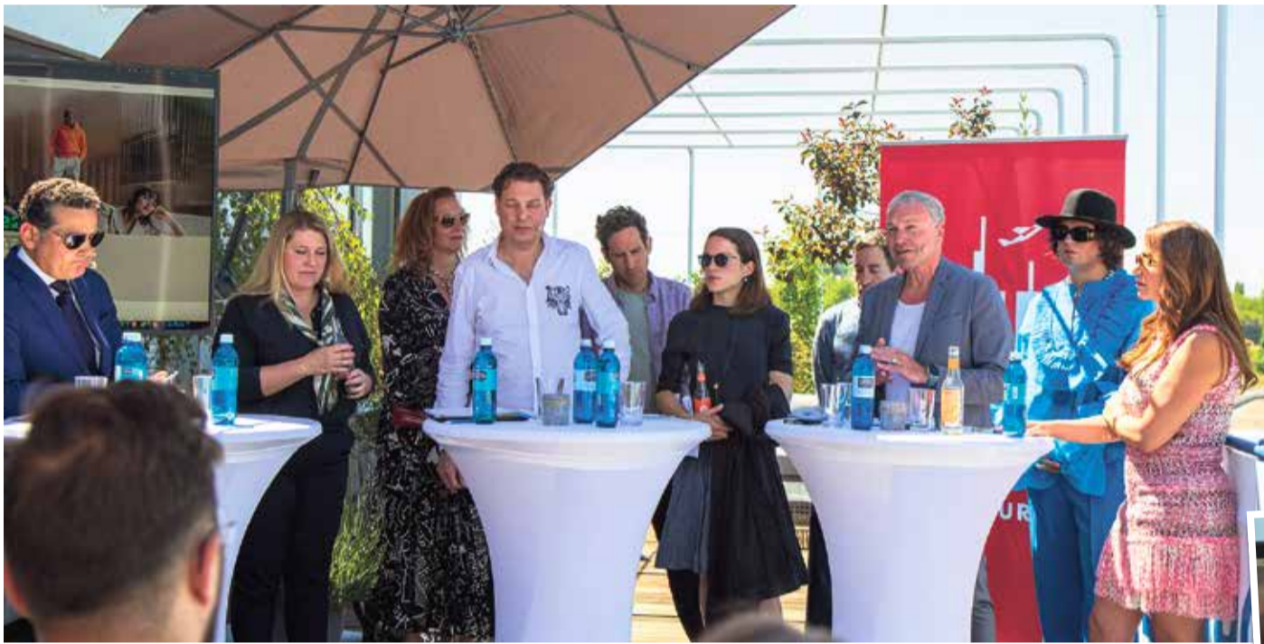
Auf der Terrasse präsentierte die Frankfurter Wirtschaftsförderung das Ergebnis von drei Monaten harter Arbeit: die Frankfurter Fashion Week und ihre Repräsentanten.