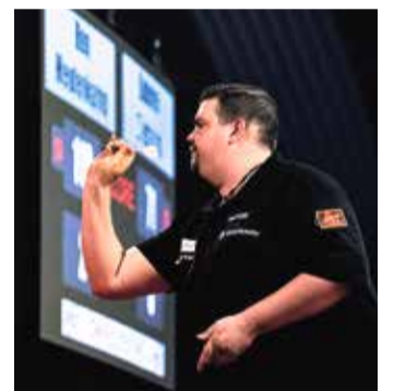
Gabriel Clemens – German Giant.

In den Jahren 2015, 2016, 2017 und 2018 fand das Turnier bereits in der Frankfurter Eissporthalle statt. Damals siegten je zweimal England (Phil Taylor, Adrian Lewis) und die Niederlande (Michael van Gerwen, Raymond van Barneveld). Alle