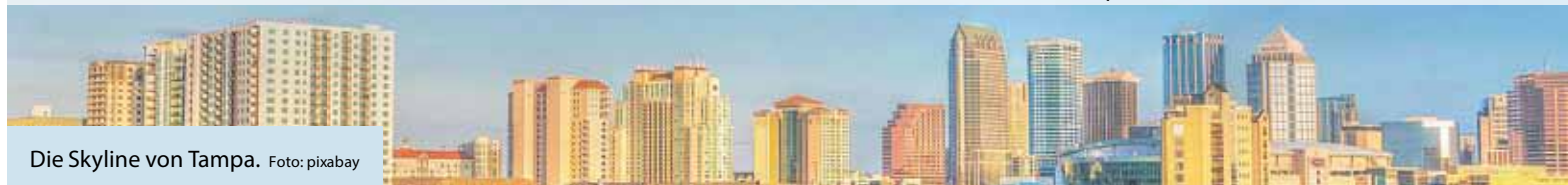
Die Skyline von Tampa.

Sonne, wohin das Auge reicht, Sandstrände und riesige Freizeitparks. Mit über 300 Sonnentagen im Jahr ist Florida eines der Top-Reiseziele für diejenigen, die es auch dann warm mögen, wenn in Deutschland bereits die kalte Jahreszeit Einzug erhalten hat. Selbst während der Wintermonate pendelt sich die Temperatur in Florida meist um die 20 Grad ein. Hawaii ausgenommen, ist Florida mit seinen rund 22 Millionen Einwohnern der südlichste Bundesstaat der USA und besteht aus einer Halbinsel und einem Festlandteil. Umgeben ist Florida vom Atlantischen Ozean an der Ostküste und vom Golf von Mexiko an der West- und Südküste.