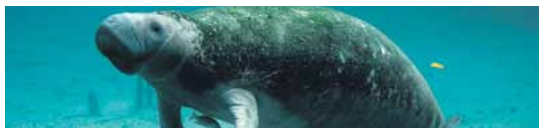
In der Nähe des Städtchens Crystal River können Urlauber*innen mit Manatees schwimmen.

Ein Urlaub in Florida lohnt sich sowohl allein als auch in größeren Gruppen. Genauso vielfältig wie der Bundesstaat selbst sind auch die Ausflugs- und Entdeckungsmöglichkeiten. Wann genau der ideale Reisezeitpunkt ist – darüber sind sich sowohl Experten als auch Reisende uneinig. Während die einen die heißen Sommermonate schätzen, gibt es auch diejenigen, die Florida lieber während der gemäßigten Wintermonate entdecken. Klar ist dabei aber auch - selbst zwischen November und März ist im Sunshine-State stets mit rund 20 Grad zu rechnen. Nicht zu unterschätzen ist allerdings die Regen- und Hurrikan Saison, die von Juli bis Oktober dauert. Zwar äußert sich diese meist nur durch kurze, heftige Regenschauer – Urlauber*innen sollten sich vor ihrem Florida-Trip jedoch auf alle Fälle auf die Wettergegebenheiten einstellen.