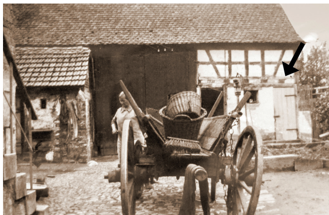
Abb. 2: Abort im Scheunengebäude Wixhäuser Straße 17. Rechts mit geschlossener Tür und Fenster der Abort, daneben mit offener Tür der Schweinestall. Davor Jauchepumpe und Mistkaute. Aufn. um 1950.

Eine Toilette benutzt man mehrmals täglich, aber man redet nicht gerne darüber. Es ist bis heute ein diskreter, tabuisierter Ort. Für Historiker, Volkskundler und Naturwissenschaftler jedoch sind die Abfallgruben der Vergangenheit wahre Fundgruben der Wissenschaft. So war der Toilettengang im alten Rom ein öffentliches, gesellschaftliches Ereignis. Mehrere Dutzend Männer und Frauen saßen nebeneinander ihre dringenden Bedürfnisse mit geschäftlichem und gesellschaftlichem Plaudern verbindend. Allerdings waren diese Latrinen, wie sie der Historiker nennt, auch Keimchleudern für Bakterien und andere infektiöse Erreger. Der Urin wurde gesondert gesammelt, da dieser zum Färben von Textilien taugte. Anderes wurde im Tiber entsorgt. Kaiser Vespasian (69-79 n.Chr.) belegte den Urin mit einer Steuer. Von ihm stammt der Spruch, dass Geld nicht stinkt. Für dies und mehr interessiert sich ein eigener Zweig der Wissenschaft – die Latrinenarchäologie.