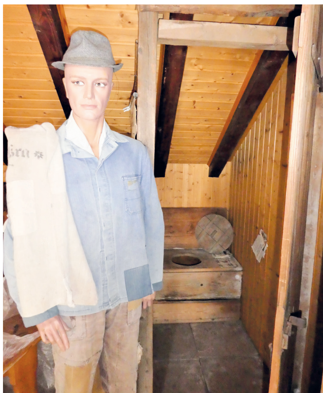
Abb. 1: Das stille Örtchen im Museum.

(Erzhausen, HS) „Das stille Örtchen“ nannte man früher jenen intimen Ort auch, als Toilettenschüsseln aus Keramik mit Wasserspülung noch nicht allgemein üblich waren. Vor siebzig Jahren gab es in Erzhausen nur wenige Toiletten im Haus. Auf dem Hof stand ein Abort über einer Jauchegrube ohne Wasserspülung und nach den Gesetzen der Schwerkraft funktionierend. Als besondere und in der Region einmalige Rarität ist im Dorfmuseum der letzte Abort des Dorfes als kulturhistorisches Dokument der Hygienebedingungen vergangener Zeiten aufgebaut. Er ist auch ein Beispiel dafür wie sich das Leben in Erzhausen in den wenigen Jahrzehnten nach dem letzten Weltkrieg rasant verändert hat. Er stammt aus dem Pfarranwesen. Doch davon später mehr.