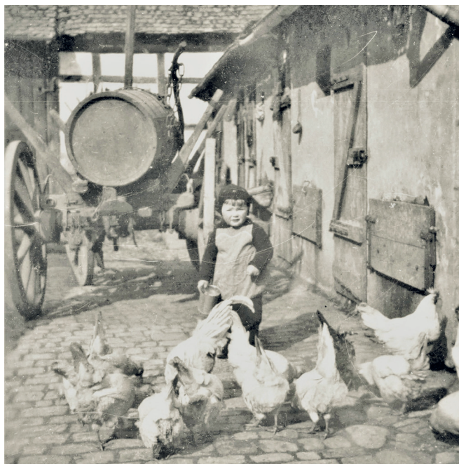
Abb. 3: Jauchewagen auf dem Hof des Anwesens Hauptstraße 33. Aufn. um 1940.

Bis in die neuere Zeit gingen die ärmeren Leute auf die Straße, ins Feld, in den Stall oder sonst wohin. Goethe soll sich angeblich oft über den Gestank auf den Straßen Frankfurts beschwert haben. Reichere, Bürger wie Burgherren, leisteten sich an Haus-