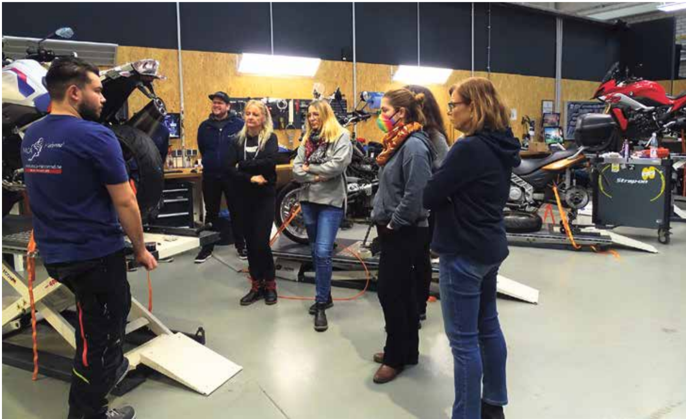
Interessiert lauschen die Frauen den MCA-Motorradprofis.