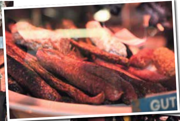
Nur das beste Fleisch- und die leckersten Wurstwaren aus liebevoller Tierhaltung.

Auch selbstgemachte grüne Soße und andere köstliche Beilagen gibt es bei Else Kalbskopp.