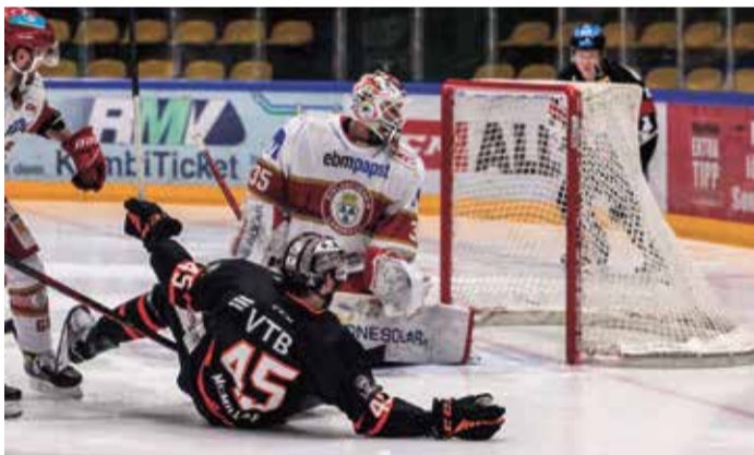
Die Frankfurter Löwen bei einem ihrer Heimspiele.