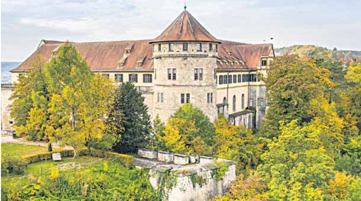
Blick auf das Schloss Hohentübingen.