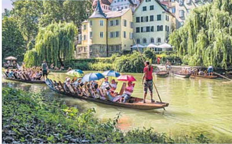
Die Stocherkahnfahrt ist sowohl für Tourist*innen als auch Einheimische ein echtes Highlight.

www.tuebingen-info.de Telefon 07071/91360