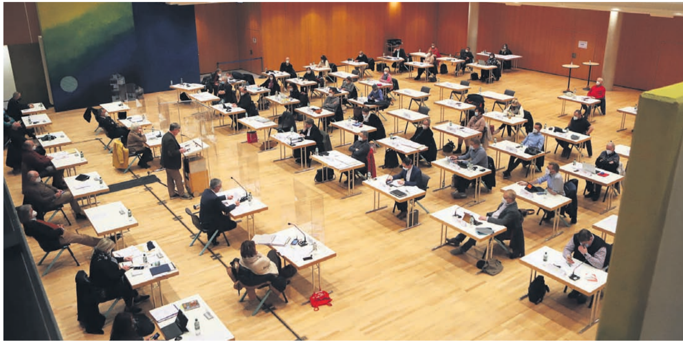
Zwei Abende dauerte die Sitzung der Stadtverordnetenversammlung, in der unter anderem der Haushalt beschlossen wurde.