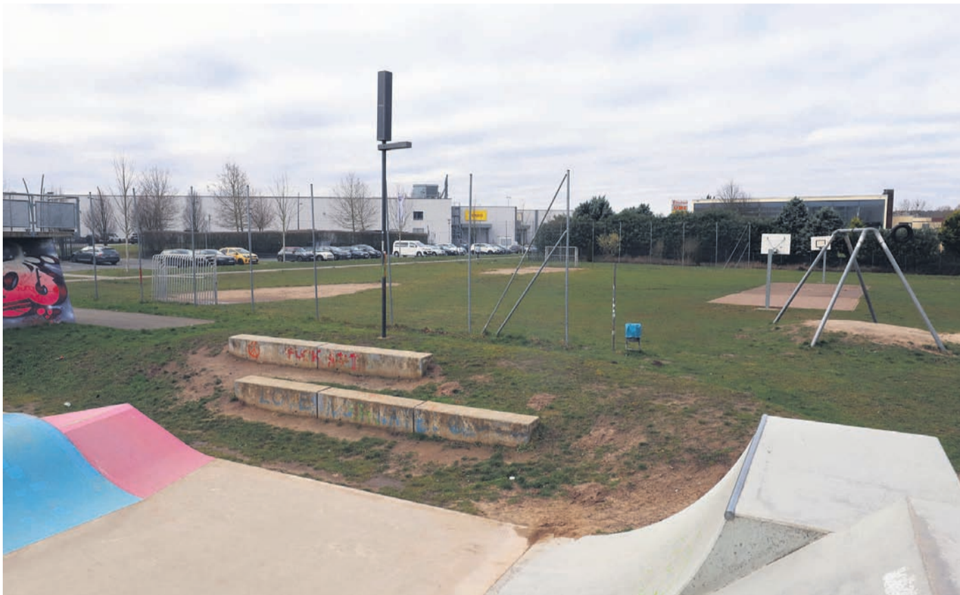
Zwischen Skateranlage und Badehaus könnte ein neues Jugendzentrum gebaut werden.

CDU, AL und SPD begrüßen Prüfung eines JUZ-Neubaus hinterm Badehaus / Kritik von der FDP