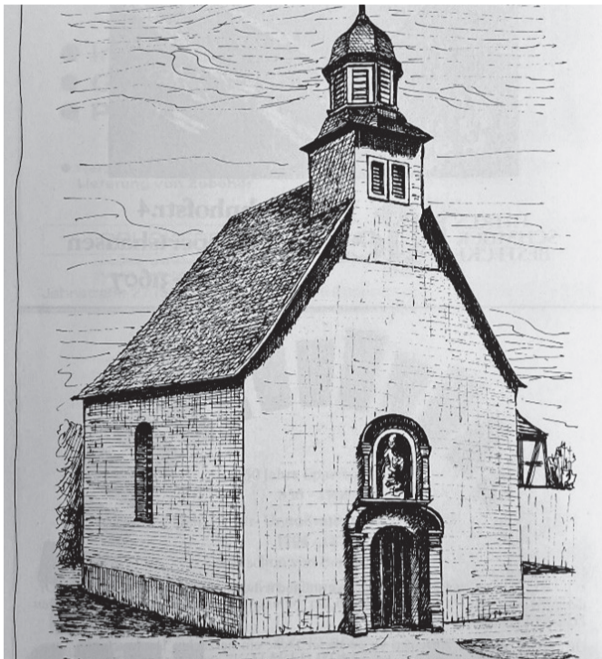
Valentinuskapelle Eppertshausen.

Der Verlauf der Römerstraßen und römische Funde. Die erste dauerhafte Besiedelung der Gegend erfolgte durch die Kelten. Die Schlackenberge im Forst Eichen geben Zeugnis von der Eisengewinnung der Kelten. Die Franken nutzten die alten Römerstraßen, um in das dichte Waldgebiet vorzudringen und es zu besiedeln. Die Flurnamen der Gemarkung lassen uns diese Siedlungsstellen erkennen. Bei der Landnahme durch die Franken wurden nur Felder und Wiesen Privateigentum. Wälder, Weiden, Gewässer und Bodenschätze blieben gemeinsames Eigentum aller. Zur Verwaltung dieser Allmend wurden Markgenossenschaf-