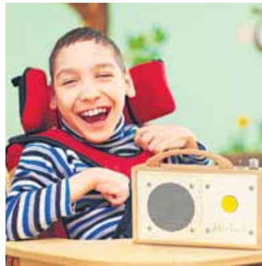
Knopf drücken und los gehts: Kinder mit besonderen Bedürfnissen können barrierefreie MP3-Player selbstständig bedienen.