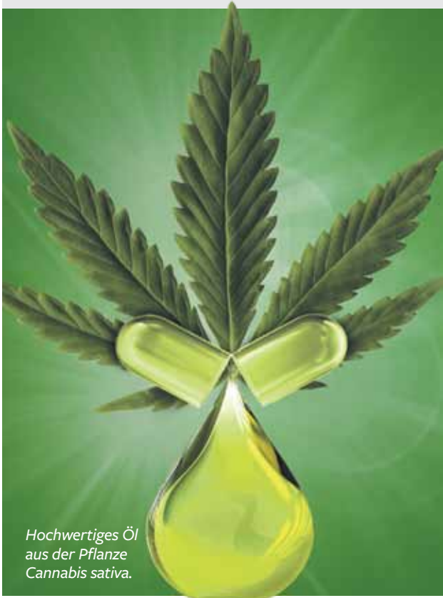
Hochwertiges Öl aus der Pflanze Cannabis sativa .