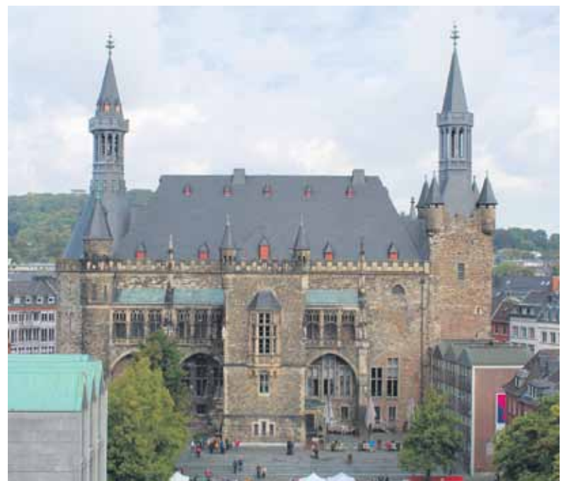
Das Aachener Rathaus.