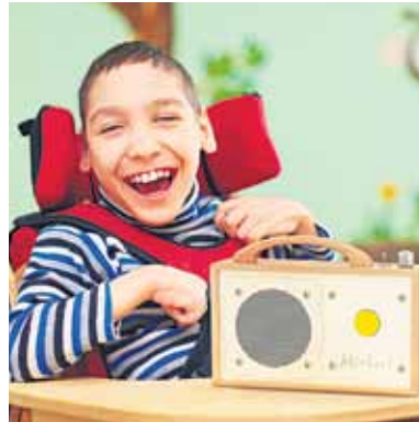
Knopf drücken und los gehts: Kinder mit besonderen Bedürfnissen können barrierefreie MP3-Player selbstständig bedienen.

Bereits vor zehn Jahren hat der Tüftler Rainer Brang aus Nürtingen den ersten „Hörbert“ entwickelt – einen nachhaltigen MP3-Player aus heimischem Holz, intuitiv zu bedienen und extra robust. Neun bunte Tasten hat der MP3-Player, mit denen kleine Musikfans einzelne Playlists aufrufen können. Auf der auswechselbaren und wiederbespielbaren Speicherkarte ist Platz für 17 Stunden Lieder und Geschichten. Und dank energiesparender Technik