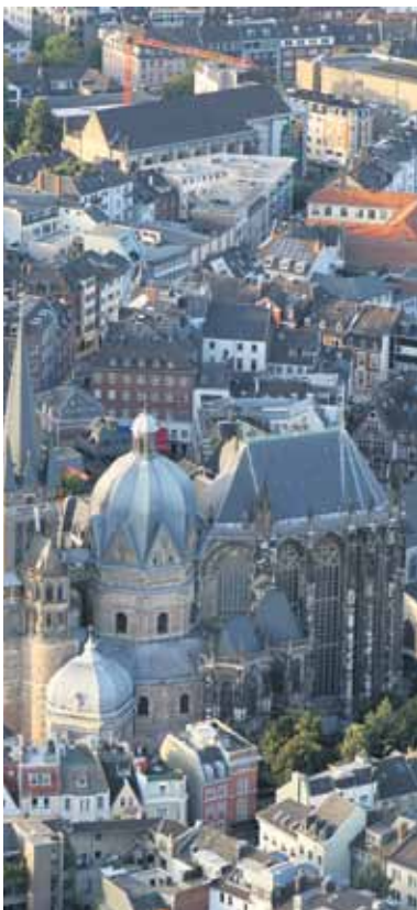
Die Aachener Altstadt von oben.

ganz besonderem Maße. Das Aachener Pontviertel greift diese Gegensätze wie kein anderer Stadtteil auf. Die bunte Mischung aus Kneipen, Restaurants und Cafés, jedoch immer vor dem Hintergrund der historischen Altstadt, machen das Aachener Studentenviertel auch für Besucherinnen und Besucher zu einem ganz besonderen Highlight. Wer in seinem Urlaub auch kulinarisch Neues entdecken möchte, ist in Aachen genau richtig. Die „Aachener Printe“ ist ein Lebkuchengebäck mit vielen Gewürzen und häufig mit Schokolade überzogen. Sie wird bereits seit 1820 in Aachen gebacken. Obwohl das Gebäck ursprünglich für die Herbst- und Winterzeit vorgesehen war, werden die Aachener Printen heute auch aufgrund der großen Beliebtheit bei Touristen ganzjährig hergestellt.