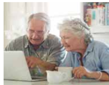
Menschen mit seltenen Erkrankungen suchen oft lange nach einem Namen für ihre Beschwerden.

nose außerdem, weil eine Transthyretin-Amyloidose den ganzen Körper betrifft,“ erläutert Prof. Dr. Knebel, Chefarzt der Kardiologie am Sana Klinikum Lichtenberg in Berlin. „Daher stehen Warnzeichen wie ein Karpaltunnelsyndrom oder eine Wirbelkanalverengung im Rücken auf den ersten Blick nicht in Zusammenhang mit einer Herzerkrankung.“ Patienten sollten deshalb mit ihrer Ärztin oder ihrem Arzt auch über Symptome und frühere Erkrankungen sprechen, die scheinbar nichts mit den aktuellen Beschwerden zu tun haben. Da die ATTR-CM erblich bedingt sein kann, gehören auch Herzerkrankungen in der Familie dazu. Besteht der Verdacht auf eine ATTR-CM, können EKG, bildgebende Verfahren, wie Echokardiographie und Skelettszintigraphie, Blut- und Urinuntersuchungen sowie eine Gewebeuntersuchung zur Diagnose beitragen. Ein Gen-