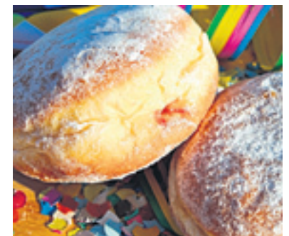
Kreppele gibt es in allerlei Variationen, Namen und Rezepten.

ralien ausgeschwemmt. Das kann zu Kopfschmerzen führen. Oberste Priorität bei einem Kater ist daher, den Flüssigkeits- und Elektrolythaushalt wieder auszugleichen. Dies geht am besten, indem man viel Wasser trinkt. Verdünnter Saft oder Kräuter- und Früchtetees sind auch gut. Von zu viel Kaffeegenuss ist eher abzuraten. Auch auf das gerne genommene Konterbier oder den Reparaturschnaps, also das Weitertrinken am Morgen, sollte man eher verzichten. Beim Essen muss sich der Magen langsam wieder eine ausgewogene Grundlage schaffen, zum Beispiel mit einem Butterbrot. Saures, wie der berühmte Rollmops, hat von den Inhaltsstoffen nur den Nutzen, dass es den Durst anregt und man mehr trinkt. Wissenschaftler haben übrigens herausgefunden, dass ein ordentlicher Kater die Leistungsfähigkeit bis zu drei Tage lang einschränken kann.