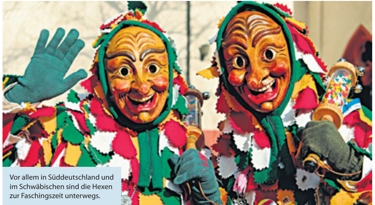
Vor allem in Süddeutschland und im Schwäbischen sind die Hexen zur Faschingszeit unterwegs.

Hintergrund ist, dass es auch vor Weihnachten, bereits kurz nach der Fixierung des Festes im Jahr 354, eine vorbereitende 40-tägige Fastenzeit gab. Ähnlich der österlichen Fastenzeit, die am Aschermittwoch beginnt. Sie begann am 11. November, dem Martinstag. Es galt, die vorhandenen Lebensmittel zu verzehren, die nicht „fastenzeittauglich“ waren, wie Fleisch, Schmalz, Eier und Milchprodukte. Auch war der Martinstag der Endtermin des bäuerlichen Jahres, an dem die Pacht fällig wurde und das Gesinde wechselte. Den Höhepunkt erreicht die Fastnacht in der eigentlichen Fastnachtswoche vom Lumpigen Donnerstag bis hin zum Faschingsdienstag. Der Lumpige Donnerstag wird vielerorts auch Weiberfasching genannt. Er markiert den Übergang von den Prunksitzungen zum Straßenfasching. In vielen Gemeinden stürmen verkleidete Frauen die Rathäuser und „übernehmen die Macht“ von den Männern. Symbolisiert wird die Machübernahme durch Schlüsselübergabe und/oder das Abschneiden der Krawatten. Die Faschingsumzüge und andere Straßenfaschingsveranstaltungen finden von Samstag bis Dienstag statt, wobei vor allem im Rheinland der Rosenmontag der Tag der Umzüge ist. Mit dem Aschermittwoch beginnt dann die Fastenzeit. In der Nacht zu Aschermittwoch um Punkt Mitternacht endet der Fasching. vielerorts wird dann der Fasching zu Grabe getragen. Im rheinischen gibt es an vielen Orten die Traditi-