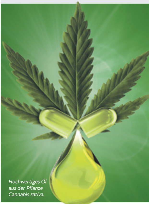
Hochwertiges Öl aus der Pflanze Cannabis sativa .