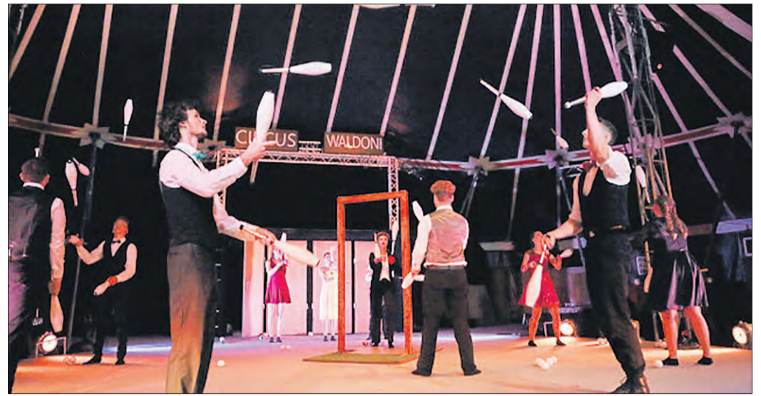
JONGLAGE in der Waldoni-Manege.

Voller Humor, Poesie und überraschenden Momenten beschreibt die Geschichte einen Neuanfang, und den oftmals schwierigen Weg vom „Ich“ zum „Wir“. Doch mehr soll nicht verraten werden, denn das Ende des Zirkus-Spektakels bleibt lange offen. Die Zuschauer dürfen gespannt sein. Kostüme, Musik, Bühnenbild und die Choreogra-