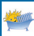
STENGER GmbH HSS

Abt-Peter-Str. 29 • 63500 Seligenstadt • Tel.: 06182/826970 E-Mail: stenger-hss@t-online.de • www.stenger-hss.de Öffnungszeiten: Mo - Fr 7.30 - 12.30 und 14.30 - 18.00 Mi 7.30 - 12.30 • Sa 8.00 - 12.00