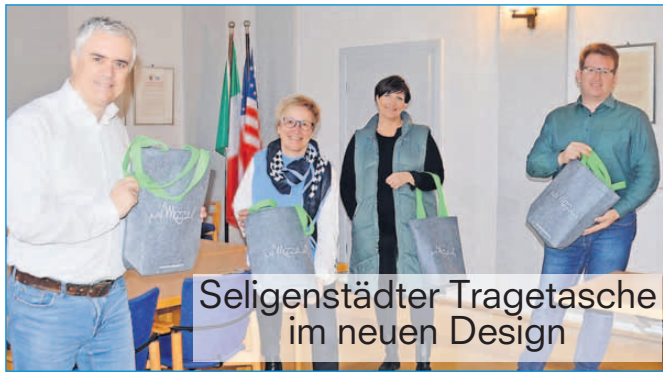
Seligenstädter Tragetasche im neuen Design

Im Jahr 2021 wurden durch das Gewerbeamt 249 Gewerbeanmeldungen, 170 Gewerbeabmeldungen und 76 Gewerbeummeldungen vorgenommen. Im Gegensatz zum vergangenen Jahr ist die Anzahl der Gewerbeanmeldungen wieder leicht um 16 gestiegen. Die Gewerbeabmeldungen gingen zeitgleich leicht zurück. Insgesamt sind bei der Stadt Seligenstadt im Jahr 2021 aktuell 2.687 Gewerbebetriebe angemeldet. Das sind 76 mehr als noch im Vorjahr. Die Anmeldungen für Gaststätten, welche entsprechend das Verwaltungsverfahren nach dem Hessischen Gaststättengesetz durchlaufen haben, ging hier in diesem Jahr zurück. Im Jahr 2020 wurden noch neun Gaststätten angemeldet, im Jahr 2021 beläuft es sich nur noch auf vier. Die Anzahl der vorübergehenden Gaststättenbetriebe, welche beispielsweise für Vereinsfeste beantragt werden, gingen coronabedingt gegenüber dem Vorjahr noch weiter zurück. Hatte das Ordnungsamt im Jahr 2019 noch 97 Anzeigen erhalten, reduzierten sich diese im Jahr 2020 schon auf 46 und im Jahr 2021 lagentsprechend das Verwaltungsverfahren lediglich noch 33 Anzeigen vor.