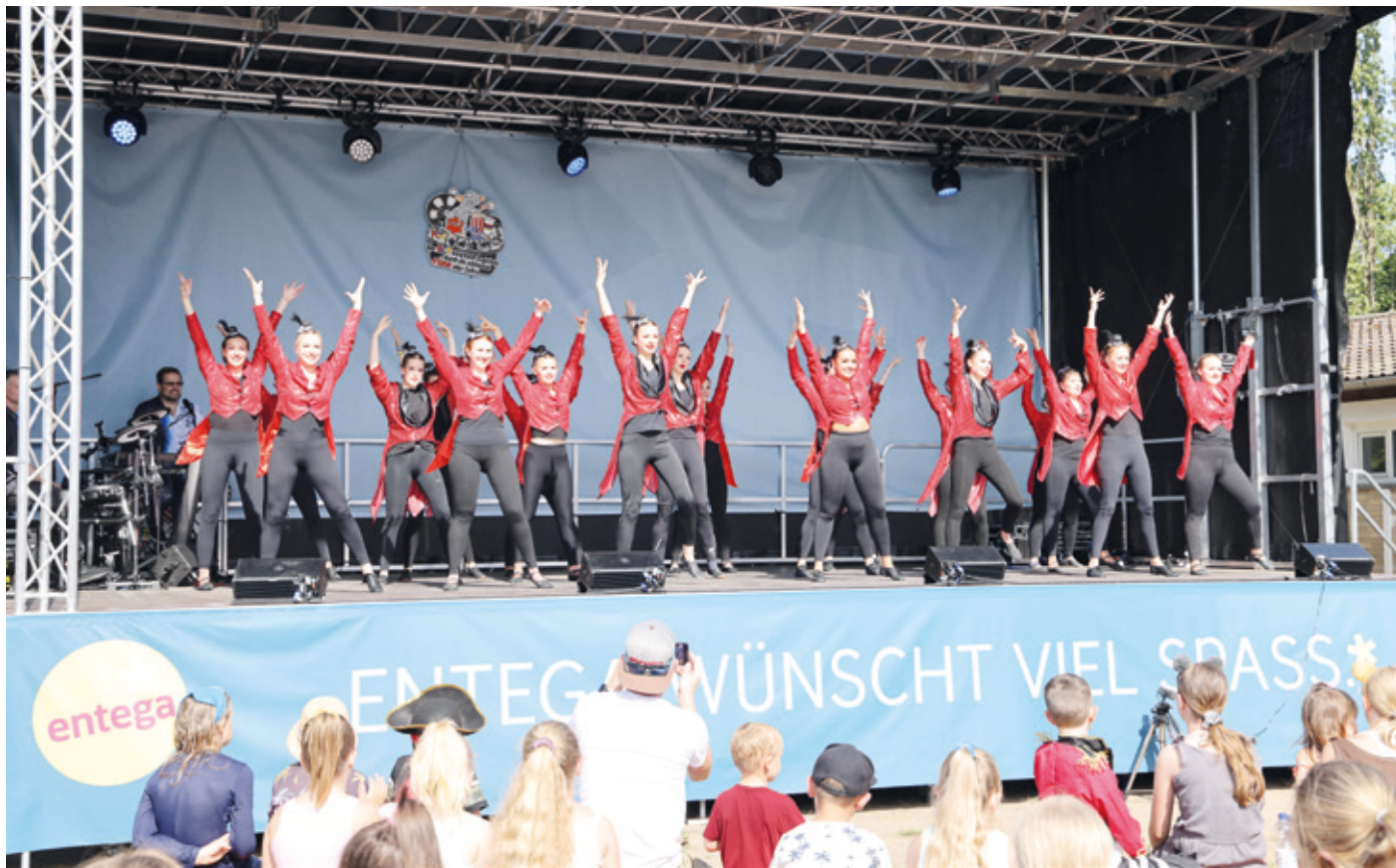
The greatest Showman – Burning Steps und Große Garde des KCA.

Der 1. Karnevalclub Arheilgen feierte am Mühlchen