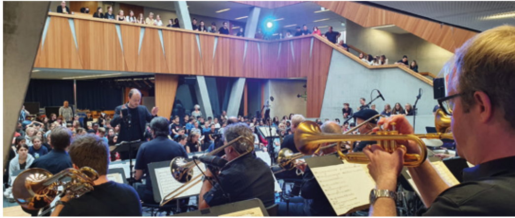
Die hr-Big-Band begeisterte die Hessenwaldschüler in der Kulturhalle.