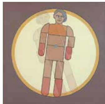
Petra Abroso „Verschiebung“ I und V, 2021, Öl/Bleistift auf Pappkarton, je 30 x 30 cm (digital überblendet).

In einem eigens dafür eingerichteten „Hör-Raum“ im Turm des Kunstforums präsentiert sie darüber hinaus eine Audio-Arbeit. Es wird also nicht nur Anregendes für die Augen, sondern auch für die Ohren geben.