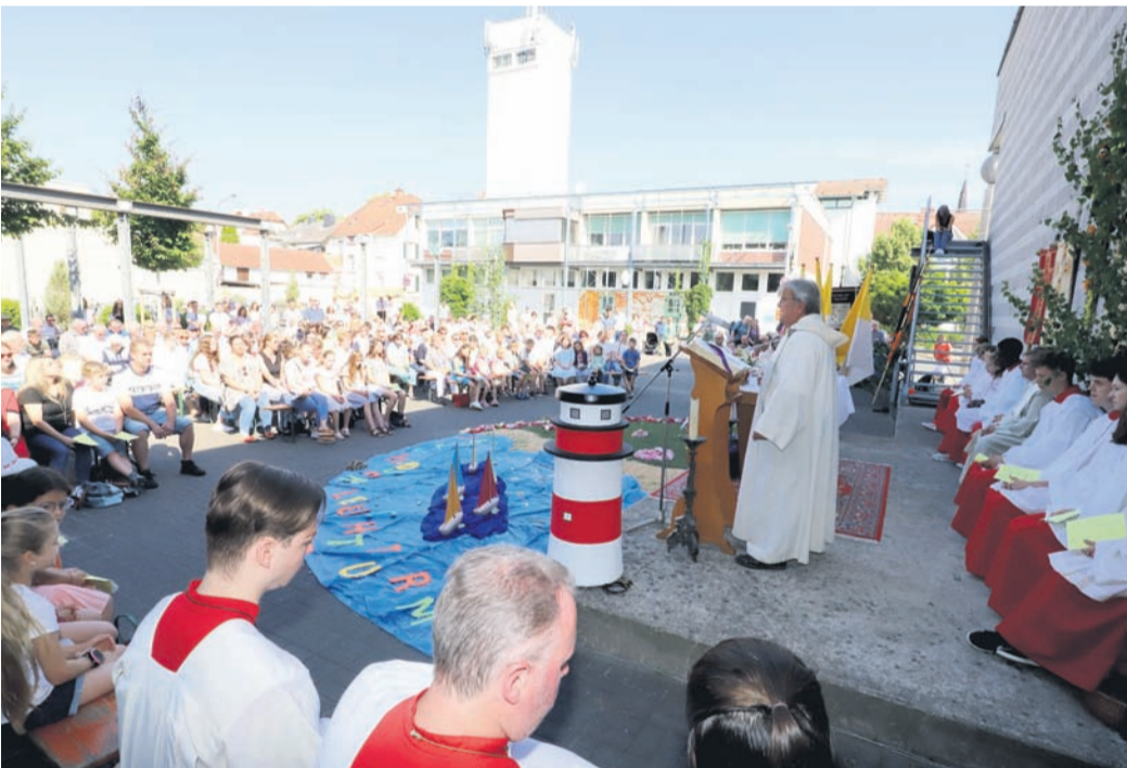
Der Fronleichnamsgottesdienst fand vor der Kulturhalle statt.

Bei den Kindern erfreute sich die Rollenrutsche großer Beliebtheit, am Stand des Kindergartens gab es weitere Spielangebote. Von Urberach war auch ein Fahrdienst nach Ober-Roden eingerichtet worden, den vor allem ältere Festbesucher nutzten.