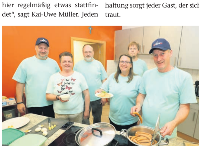
Das Orgateam, hier ein Bild vom „Hessen Friday“ vor knapp zwei Wochen, lädt auch am morgigen Freitag in die Martinusstube im Forum St. Nazarius ein. Dann gibt es einen Karaoke-Abend.

Für den weiteren Jahresverlauf hat das Orgateam unter anderem einen mexikanischen und einen spanischen Abend, einen Comedy-Abend, ein Oktoberfest und einen norddeutschen Abend geplant. Für den morgigen Freitag, 24. Juni, lädt das Orgateam ab 19.30 Uhr zu einem Karaoke-Abend in die Martinusstube ein. Es werden kleine Snacks serviert, für die musikalische Unterhaltung sorgt jeder Gast, der sich traut.