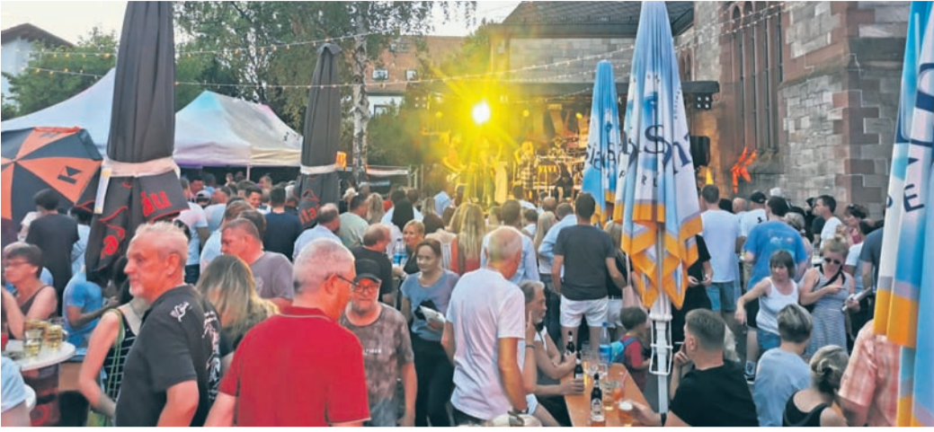
Bei den Konzerten herrschte am Samstag im Kirchgarten Hochbetrieb.

„Après-Ski-Komitee“ feiert mit zwei Bands eine gelungene Premiere