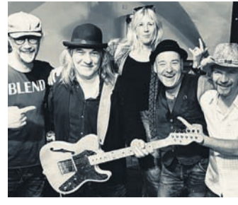
Urban Folk Junkies. (Foto: Künstler)