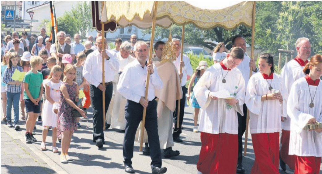
Mitglieder beider Gemeinden zogen bei der Prozession durch die Straßen.