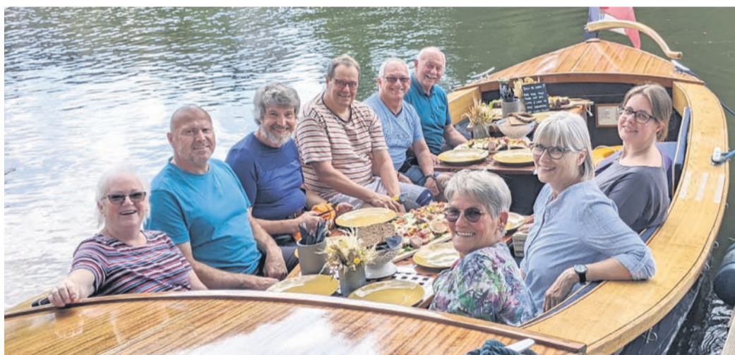
Die Kirchenvorstände begeben sich mit der „Elisabeth 2“, einem umgebauten Kutter, auf Fahrt auf der Lahn.

Am frühen Nachmittag ging es dann aber erst noch einmal in die Marburger Altstadt, die dort Oberstadt genannt wird. Beginnend an der Elisabethkirche im Lahntal ließ man sich die Geschichte der Heiligen Elisabeth erklären, kam über den Marktplatz zur alten Universität, welche die Fakultät der Evangelischen Theologie beherbergt. Zwischenzeitlich war die Nachhut der arbeitenden Kirchenvorstandsmitglieder angekommen, so dass man nach gemeinsamen Abendessen sich auf Thema der Klausur einstimmen lies: In seiner Andacht griff Pfarrer Möbus die Frage auf, warum Jesus ausgerechnet Fischer als erste Jünger auswählte hatte. Die Antwort fand der Pfarrer in einer brasilianischen Gemeinde von Fischern: „Wer sich zu Land bewegt, der baut eine Straße und benutzt dann immer wieder den gleichen Weg. Ein Fischer aber sucht die Fische dort, wo sie