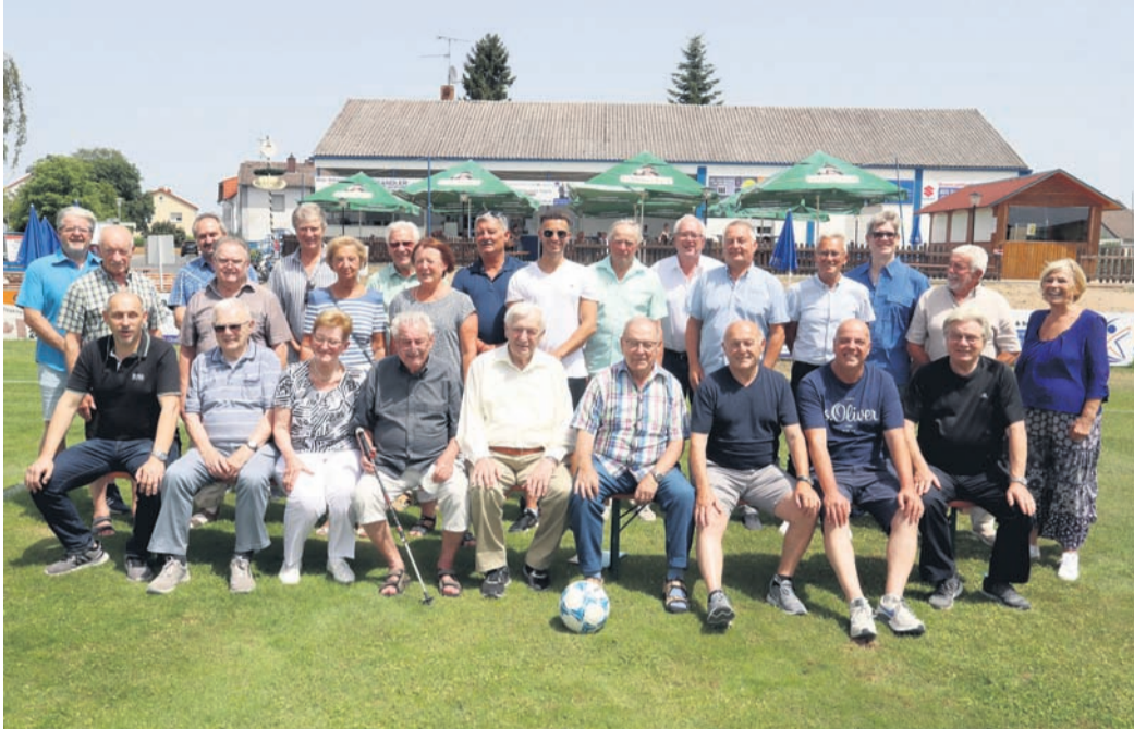
Die Geehrten des SV Münster.