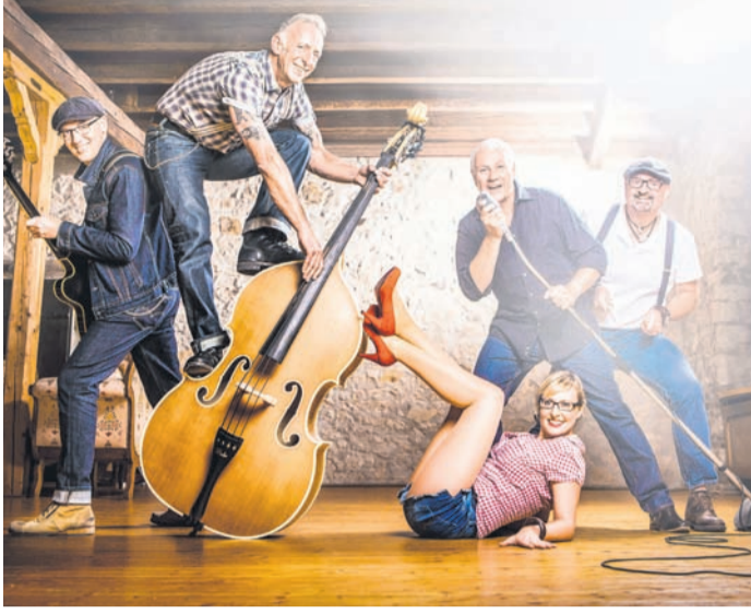
RABAZ & Missy Bee.

5 Stände, die durch Ortsvereine und ortsansässiger Gastronomie für die Bewirtung sorgen. So gibt es vom Bier, Wein und nichtalkoholischen Getränken