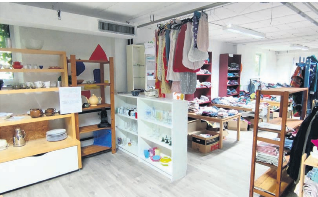
Heller, freundlicher und aufgeräumter ist die Kleider- und Sachspendenkammer für Geflüchtete auch dank einiger Regal-Spenden geworden.

Besteck, Geschirr, Kochutensilien, Töpfe, Pfannen und Elektroküchengeräte (Mixer, Was-