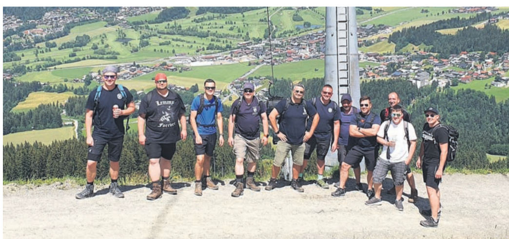
Ausflug nach Ellmau.

Schilderträger für den Festumzug gesucht: Für den Festumzug am Sonntag, 10. Juli, werden aktuell noch Schilderträger gesucht, welche vor den einzelnen Gruppen laufen und die Schilder mit den Namen des Vereins oder der Feuerwehr tragen. Die Kinder sollten etwa 7 bis 12 Jahre alt sein, sollten ein kleines Holzschild tragen können und rund 1,5 Kilometer gemütlich laufen können. Bei Interesse oder auch Fragen Mail an schildertraeger@feuerwehr-muenster.com .