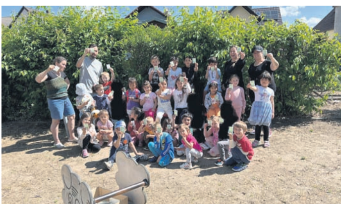
Die Sonnenblumen-Kinder und Mitarbeiter*innen mit den WildblumenSamentütchen.