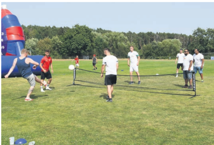
Auf dem Naturrasen-Großfeld des Eppertshäuser Sportzentrums konnte man am Samstag nicht nur Fußball-Darts, sondern auch Fußball-Tennis spielen.