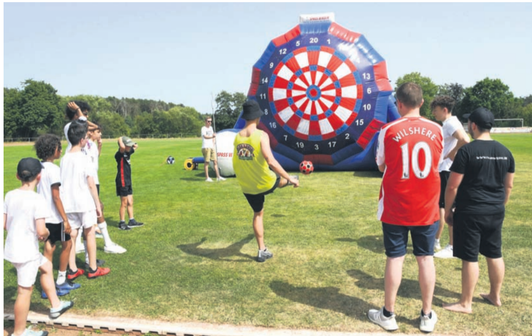
Beim Turnier im Fußball-Darts machten am Samstagabend im Eppertshäuser Sportzentrum zwölf Teams mit.

Eppertshausen (jedö) Hinsichtlich seines 100-jährigen Bestehens, das man 2020 groß hatte feiern wollen, erlitt der FV Eppertshausen maximales Pech: Corona torpedierte nicht nur das Jubiläumsjahr selbst, sondern auch 2021, als man auch das Nachholen der ausgefallenen Veranstaltungen für unverändert unverantwortbar hielt. Spricht man in diesen Tagen mit Verantwortlichen des Fußball-Vereins - ob an Pfingsten bei den Juniorenturnieren oder am Wochenende bei zwei weiteren Events im Sportzentrum -, wird aber klar, dass der FVE das Malheur abgehakt hat. Der Blick geht nach vorn und verheißt Gutes: Der trotz seines scheinbar eindeutigen Namens in mehreren Sparten (neben dem Fußball auch in der Gymnastik und via FVCA natürlich in der Fastnacht) aktive Verein hat sich in jüngerer Vergangenheit in vielen Bereichen bestens für die Zukunft präpariert. So bei der Infrastruktur im Eppertshäuser Sportzentrum, das zwar der Gemeinde gehört, wo sich der FVE aber gerade in den Umbau des Hartplatzes in einen Kunstrasen massiv personell und finanziell einbrachte. Während der große Kunstrasen und die beiden kleinen Kunstrasen-Bolzplätze (die demnächst noch besser mit Flutlicht ausgeleuchtet werden sollen) praktisch daliegen wie am Tag ihrer Einweihung, war das Vereinsheim in die Jahre gekommen. Seit Spätsommer 2021 sanierte der FVE die Im-