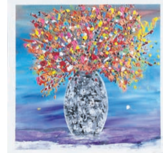
Window of hope.

werke seines Opas, kam er im Erwachsenen-Alter selbst zur Malerei, die mittlerweile zu seiner Leidenschaft geworden ist. Er lebte im Rodgau und in Münster bei Dieburg. Mittlerweile ist er in der Einhardstadt Seligenstadt zu Hause. Seine Inspiration holt er sich aus allem, was die Natur zu bieten hat. Weitere Infos unter www.krischan-finearts.de .