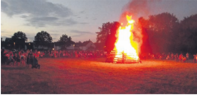
Sonnenwendfeuer in Eppertshausen.

Das Brauchtum der Sommersonnenwende hat seinen Ursprung vor allem im germanischen Volksglauben. Die Sommersonnenwende, der längste Tag und die kürzeste Nacht mit dem höchsten Stand der Sonne, war ein wichtiger Einschnitt im bäuerlichen Jahreszyklus. War im Frühjahr der Regen dem Wachstum der Knospen und Früchte förderlich, so sollte von nun an die Sonne die Ernte reifen lassen. Der katholischen Kirche war ein solch heidnisches Brauchtum zuwider. Als Verbote nicht fruchteten, wurde das Sonnenwendfest christianisiert und mit dem Geburtstag Johannes des Täufers am 24. Juni verknüpft. Aus dem Sonnenwendfeuer wurde allmäh-