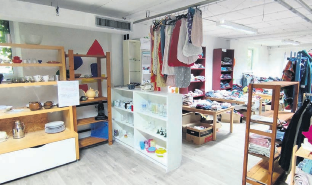
Heller, freundlicher und aufgeräumter ist die Kleider- und Sachspendenkammer für Geflüchtete auch dank einiger Regal-Spenden geworden.

Münster (MA) Die Kleider- und Sachspendenkammer für Geflüchtete im ehemaligen JUZ (Bahnhofstraße 52) ist in neuer, freundlicher Optik weiterhin für die Menschen da. Dank einiger Regalspenden sieht es inzwischen deutlich aufgeräumter und heller aus, damit sich beim Stöbern nach Kleidung und Co. auch jede*r wohlfühlt und findet, was er oder sie sucht.