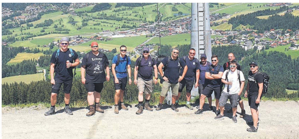
Ausflug nach Ellmau.

Schilderträger für den Festumzug gesucht: Für den Festumzug am Sonntag, 10. Juli, werden aktuell noch Schilderträger gesucht, welche vor den einzelnen Gruppen laufen und die Schilder mit den Namen des Vereins oder der Feuerwehr tragen. Die Kinder sollten etwa 7 bis 12 Jahre alt sein, sollten ein kleines Holzschild tragen können und rund 1,5 Kilometer gemütlich laufen können. Bei Interesse oder auch Fragen Mail an schildertraeger@feuerwehr-muenster.com .