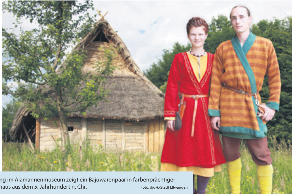
Das Plakatmotiv der Sonderausstellung im Alamannenmuseum zeigt ein Bajuwarenpaar in farbenprächtiger Kleidung vor einem typischen Wohnhaus aus dem 5. Jahrhundert n. Chr.

(DJD-K). Über 1.250 Jahre Geschichte haben die vom stolzen Schloss überragte Stadt Ellwangen geprägt und ein besonderes Ambiente geschaffen. Gäste können dort viele Kunst- und Bauschätze entdecken. Eines der kulturellen Highlights Ellwangens ist das Alamannenmuseum, das wichtige archäologische Originalfunde aus ganz Süddeutschland beherbergt. Bis zum 18. September lädt die Sonderausstellung „Ein kleines Dorf in einer großen Welt – Alltagsszenen des 5. und 6. Jahrhunderts“ zu einer spannenden Entdeckungsreise in die Welt des frühen Mittelalters ein. Mit Originalfunden, Repliken und viel Liebe zum Detail werden Themenbereiche wie häusliches Leben und Wohnen, Kleidung und Handwerk, Ackerbau und Viehzucht dargestellt. Informationen gibt es unter www.ellwangen-tourismus.de .