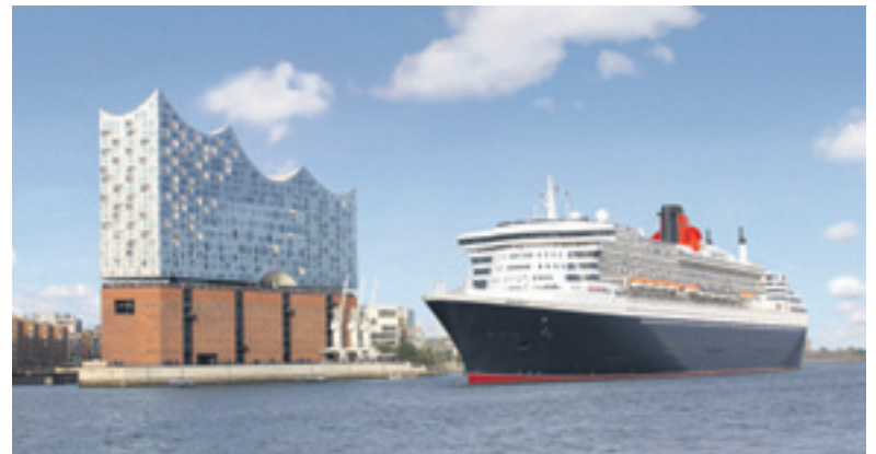
Ein Kurzurlaub mit Ziel Hamburg kann eine willkommene Auszeit vom Alltag sein. Im Bild zeigt sich die Queen Mary 2 vor der Elbphilharmonie.

auf der Queen Victoria zu den malerischen norwegischen Fjorden unternehmen, Start ist in Kiel, Ankunft in Southampton. Oder wäre es mit einer zehntägigen Ostsee-Tour? Von Hamburg aus geht es über Kopenhagen und Stockholm bis ins Baltikum und von dort zurück nach Kiel.