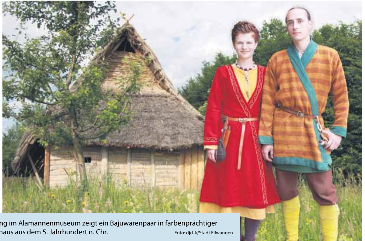
Das Plakatmotiv der Sonderausstellung im Alamannenmuseum zeigt ein Bajuwarenpaar in farbenprächtiger Kleidung vor einem typischen Wohnhaus aus dem 5. Jahrhundert n. Chr.

(DJD-K). Über 1.250 Jahre Geschichte haben die vom stolzen Schloss überragte Stadt Ellwangen geprägt und ein besonderes Ambiente geschaffen. Gäste können dort viele Kunst- und Bauschätze entdecken. Eines der kulturellen Highlights Ellwangens ist das Alamannenmuseum, das wichtige archäologische Originalfunde aus ganz Süddeutschland beherbergt. Bis zum 18. September lädt die Sonderausstellung „Ein kleines Dorf in einer großen Welt – Alltagsszenen des 5. und 6. Jahrhunderts“ zu einer spannenden Entdeckungsreise in die Welt des frühen Mittelalters ein. Mit Originalfunden, Repliken und viel Liebe zum Detail werden Themenbereiche wie häusliches Leben und Wohnen, Kleidung und Handwerk, Ackerbau und Viehzucht dargestellt. Informationen gibt es unter www.ellwangen-tourismus.de .