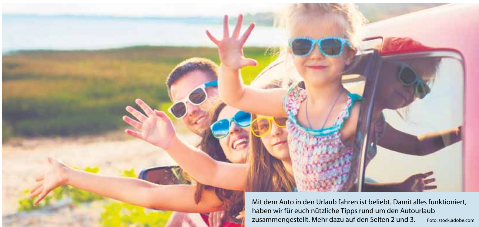
Mit dem Auto in den Urlaub fahren ist beliebt. Damit alles funktioniert, haben wir für euch nützliche Tipps rund um den Autourlaub zusammengestellt. Mehr dazu auf den Seiten 2 und 3.

Das Leben in und um Heusenstamm/Dietzenbach, Auflage 17.040