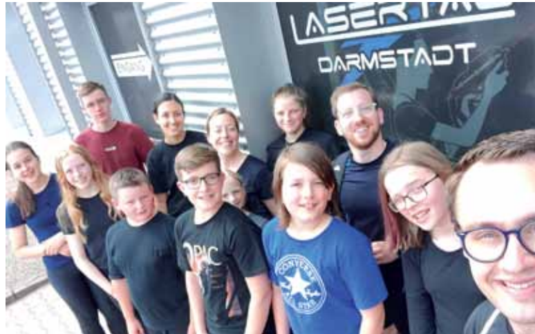
Das Bild zeigt die Teilnehmer des Ausflugs zu Lasertag in Darmstadt.

RÖDERMARK (PM). Am Sonntag, den 16. Juli 2022 ist es endlich wieder soweit: Die Jugend des Musikvereins Viktoria 08 Ober-Roden präsentiert sich auf ihrem Konzert „Musik am Nachmittag“. Ab 11 Uhr laden die Jugendlichen auf das Gelände des 1. FC Germania Ober-Roden in der Frankfurter Straße, um dort ihr Können zu präsentieren. Der Eintritt ist frei. Zur Vorbereitung des Konzerts legte die Jugend dafür ein Probenwochenende ein. Man traf sich Freitags zur üblichen Zeit zur Probe. Im Anschluss daran hat der Jugendausschuss aber einen Filmabend vorbereitet. Bei Popcorn und Co. sahen sich die Kinder und Jugendlichen den neuen