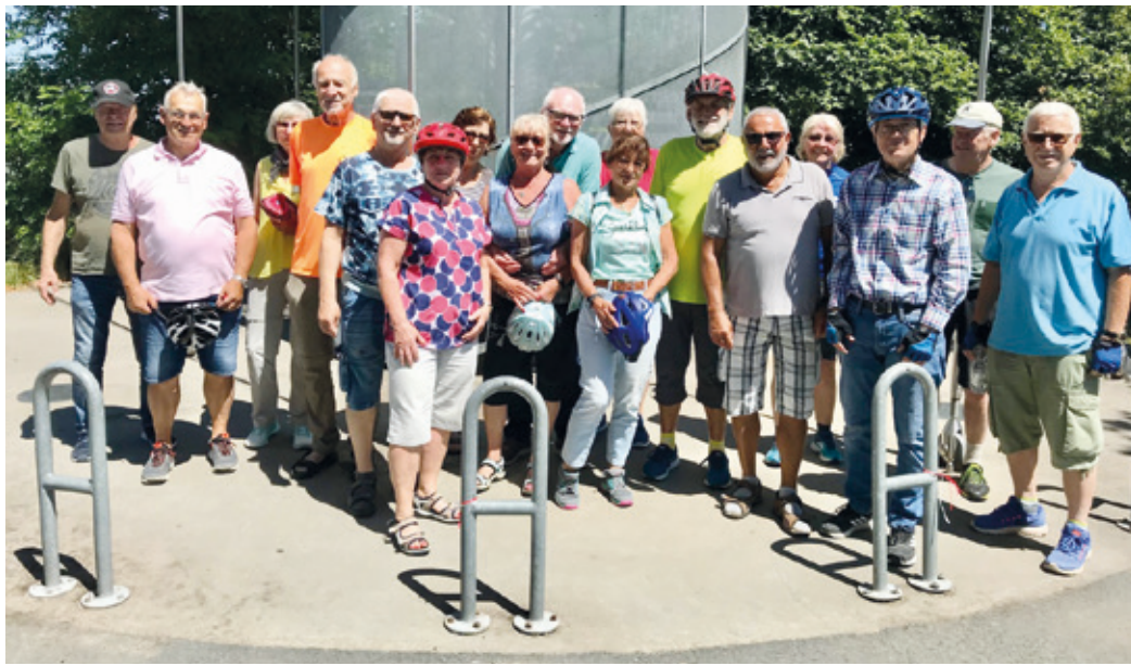
Aufenthalt am Wingertsturm in Dietzenbach.