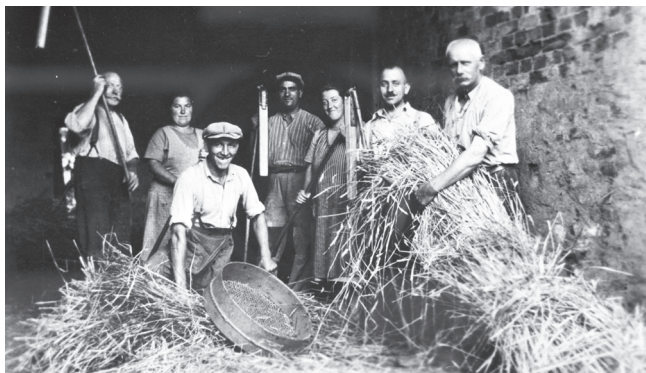
Abb. 2: Scheunendrecher in der Scheune des Anwesens Brühlstraße 2 (Aufn. um 1938).