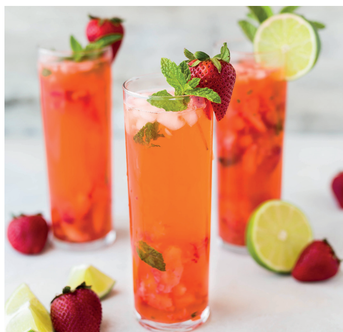
Entspannt in den Abend! Von Juli bis Ende September gibt es wieder Cocktail-Abende im Café Sammeltasse in Erzhausen.