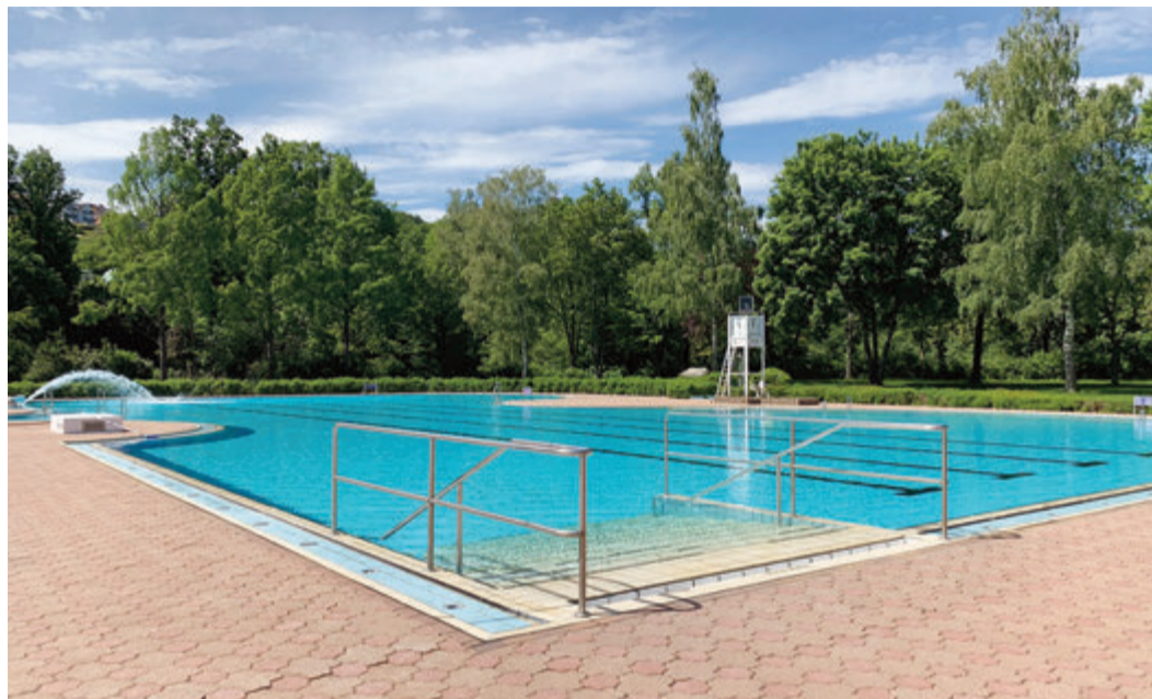
So leer wird man das Becken bald nicht mehr sehen.