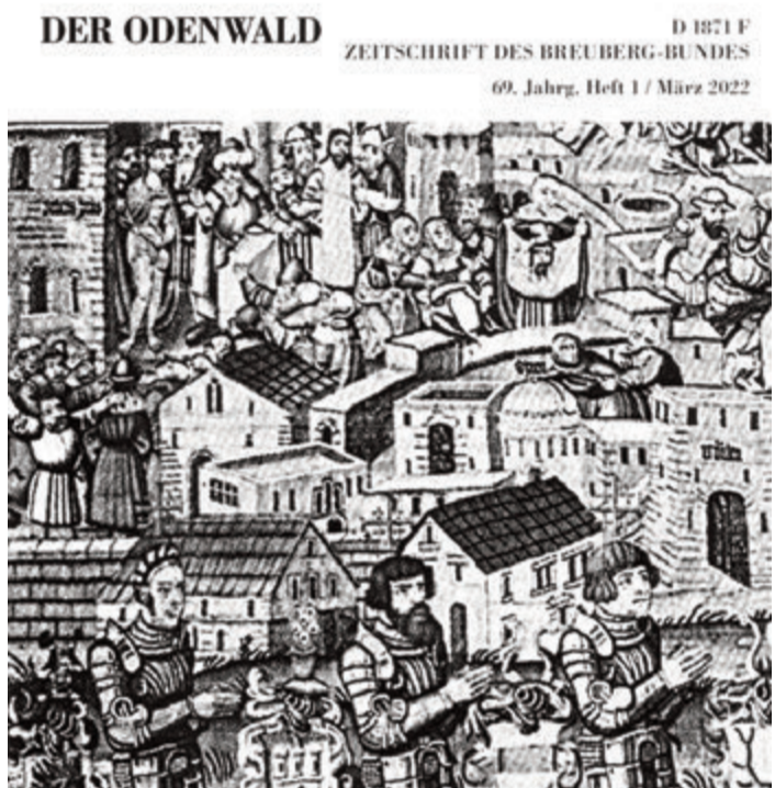
Das Cover des Heftes.