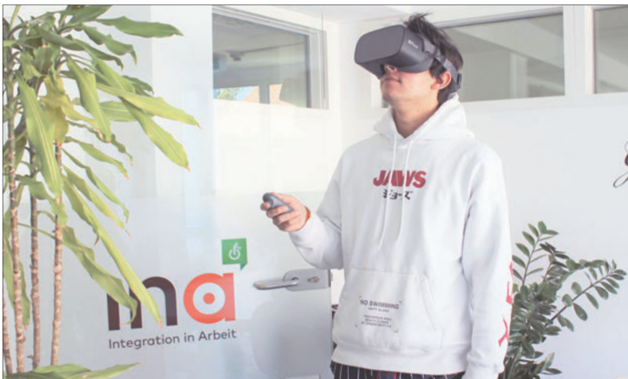
Teilnehmer mit VR-Brille.

Virtuelle Realität – ein Zugang zu Wunschberufen