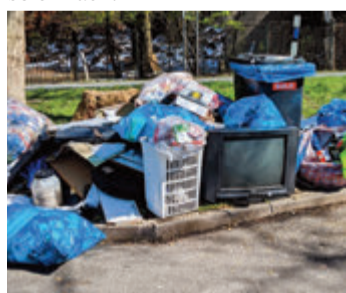
Die Parkbucht bei Mümling-Grumbach.

Also, von mir aus darf es gern das Zehnfache sein, nur werden die Täter meist nicht erwischt. Ich plädiere dafür, zumindest an den Parkbuchten und den Müll-Hotspots Webkameras anzubringen, aber das ist rechtlich leider nicht so einfach.