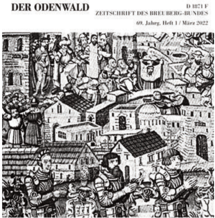
Das Cover des Heftes.