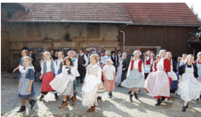
Dreimal musste das Musical verschoben werden.

Lediglich die Aufführungstermine und einige Anfangszeiten haben sich geändert. red