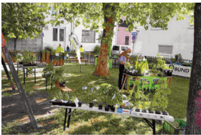
Abgabe ist am 7. Mai.

Gleichzeitig suchen andere Gartenfreunde zur selben Zeit nach neuen Pflanzen. Wir wollen mit dem Pflanzenbasar einen Austausch organisieren, der diese Lücke schließt.“ Nicht nur Gartenbesitzer sind angesprochen, sondern auch jeder, der eine Zimmerpflanze hat, kann sich an der