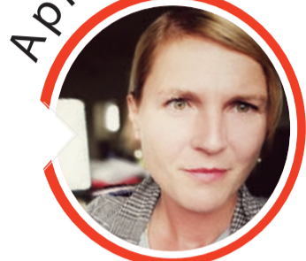
von Sandra Breunig, Redaktionsleiterin