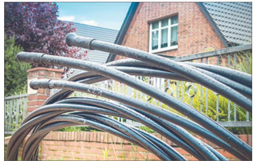
Die flächendeckende Versorgung mit deutlich schnellerem Glasfaseranschluss nimmt Fahrt auf.