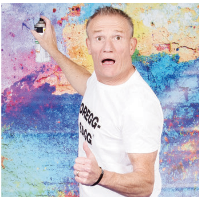
„De Dreggsagg“ Michl Müller beim Versprühen guter Laune.

Mömlingen. Michl Müller, bekannt aus den TV-Quotenrennern „Fastnacht in Franken“ und „Drei. Zwo. Eins. Michl Müller“, ist mit seinem neuen Programm „Verrückt nach Müller“ seit März 2021 auf Tour und am Samstag, 14. Mai, in Mömlingens Kultur- und Sporthalle zu Gast. Freunde des Kabarett und Interessierte können sich auf einen mitreißenden, authentischen Abend mit dem fränkischen Gesamtkunstwerk freuen. Müller bewegt sich ein weiteres Mal mit Leidenschaft zwischen Kabarett und Comedy. Von den kleinen Alltagsgeschichten bis hin zur großen Politik, mal als Spaßmacher, mal als Kabarettist, so macht das Naturtalent vor keinem Thema halt, und es sprudeln die Pointen. Des Weiteren hat der selbsternannte „Dreggsagg“ (Fränkisch für „Schelm“) aus der Rhön auch „schräge“ Lieder im Repertoire. Ein verrücktes Programm in einer verrückten Zeit - das ist der rote Faden, der sich durch Müllers Performance zieht.