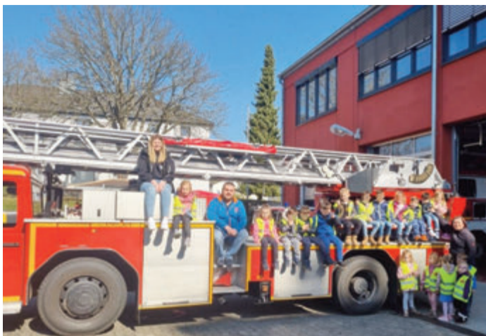
Die Kinder der Eichhörchengruppe der Erbacher Kita Mobilé konnten während eines Feuerwehrprojekts ein Feuerwehrfahrzeug begutachten.

Auch im Kindergarten wurde für einen Einsatz der Feuerwehr geübt und alle Kinder waren Teil einer Evakuierungsübung. Zum Abschluss des Projektes gab es schließlich noch einen Kuchen in Form eines Feuerwehrautos und einen Film über „Feuerwehrmann Sam“. red/stadt erbach