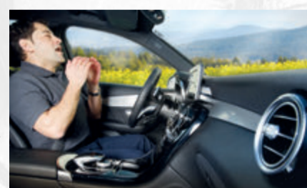
Der Autofahrer ist abgelenkt und nicht auf den Verkehr konzentriert.

Jacken und Mäntel verstaubt man nach Möglichkeit vor der Abfahrt im Kofferraum. Zusätzlich ist es hilfreich, wenn die Fenster während der Fahrt geschlossen bleiben, um den direkten Kontakt mit den Pollen zu vermeiden. (mid/ak-o)