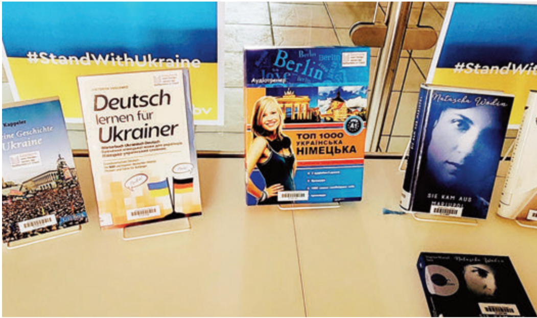
In der Stadtbücherei Erbach können sich Interessierte nun ausgiebig über die Ukraine informieren.