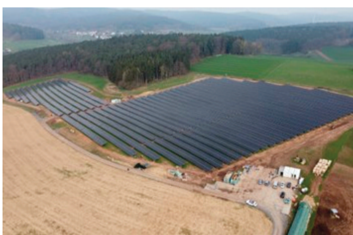
Der Solarzellenpark auf der Pferdekoppel.

Die beidseitig aktiven Module sind aufgrund der 25°-Neigung