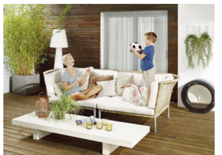
Holz sorgt für ein natürliches und behagliches Flair auf der Terrasse.

4. Die neue Terrasse selber bauen oder Profis beauftragen? Solider Unterbau, Drainage,