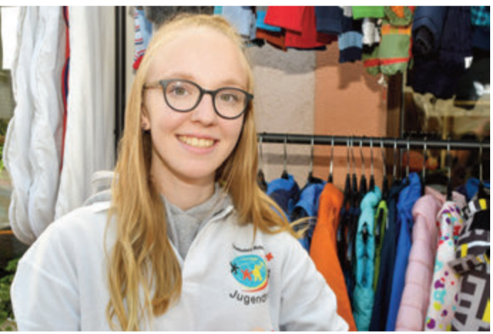
Ukraine.Spende.Jugendliche: Besonders benötigt wird intakte Bekleidung für Jugendliche.

Erbach/ Reichelsheim. Wie der Kreisverband des Deutschen Roten Kreuzes im Odenwaldkreis mitteilt, können Menschen aus der Ukraine derzeit Kleidung in seinen beiden Secondhandläden kostenlos erhalten. Nachgefragt werden bevorzugt Textilien für Frauen und Kinder. Besonders jedoch mangelt es derzeit an Kleidungsstücken für Jugendliche. Über gut erhaltene Anziehsachen jeglicher Art freuen sich gerade jetzt die Neuankommenden. Damit das Rote Kreuz weiterhin diesbezüglich tätig werden kann und die Lager nicht leerlaufen, bitten die beiden Läden um gepflegte Spenden wertiger Kleidung.