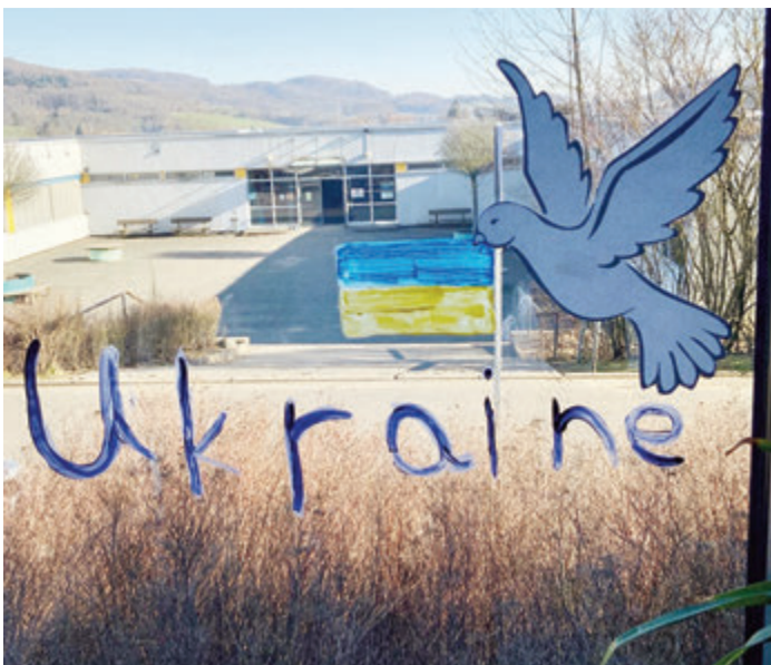
Fenster in der Schule.

Das gespendete Geld wird die GAZ der Schule vor Ort zukommen lassen, sodass sowohl die