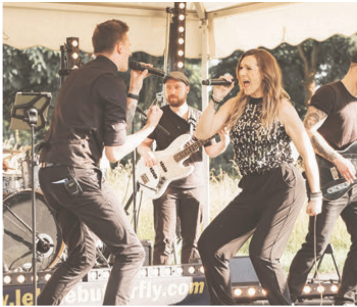
Bereits im vergangenen Jahr trat unter anderem die Band „Let the butterfly“ in Dieburg auf. Auch in diesem Jahr werden wieder namhafte Künstler erwartet.

Während des Programms können die Zuschauer somit Live-Musik genießen oder sich an spannenden Interviews erfreuen.