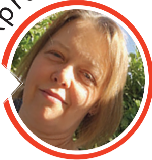
von Clarissa Yigit, Redaktion