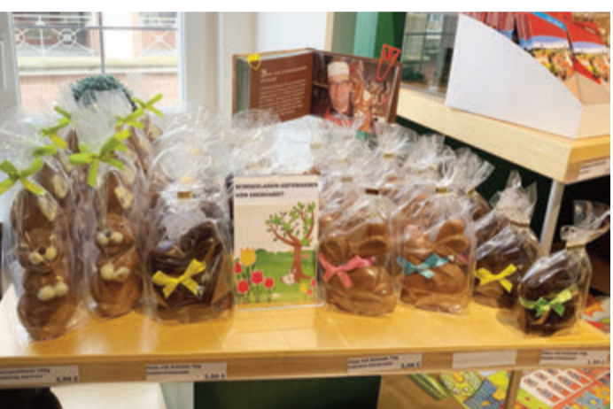
Leckereien dürfen nicht fehlen.

Erbach. Die Touristik-Information mit Odenwald-Laden im Alten Rathaus in Erbach hat ihr Sortiment frühlingsfit gemacht und neue Produkte im Angebot. Neben Schokoladenosterhasen von Eberhardt Schokolade aus Beerfurth sind ab sofort die Neuaufgabe der kostenlosen Wanderkarten für den Nibelungensteig erhältlich. Auch weitere Odenwälder Köstlichkeiten kommen im Odenwald-Laden nicht zu kurz. So wird für Feinschmecker das regionale Angebot ab sofort um den Fruchtlikör „Dabbeblut“ und den Kräuterlikör „Räubertrunk“ des Odenwälder Dabbejägers ergänzt. Schon seit ein paar Monaten können außerdem Weine von der Odenwälder Winzergenossenschaft Vinum Autmundis erworben werden. Für Gartenliebhaber hat die