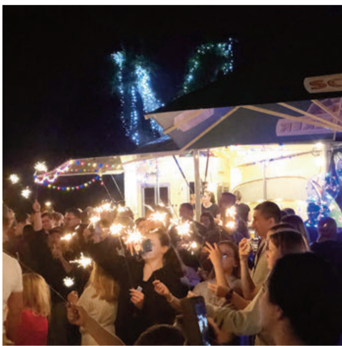
Ein Lichtermeer und andächtige Gesichter.

Reichelsheim. Die Reichelsheimer „Nachtschwärmerei“ ist stets etwas Besonderes, überall genießen die Menschen die ersten echten Frühlingswochenenden. Möglich gemacht hat die Veranstaltung ein an die Situation angepasstes, dezentrales Programm. Als sich die Corona-Pandemie im März 2020 ausbreitete, war die Absage der Nachtschwärmerei eine der ersten Entscheidungen. Umso mehr haben sich die Veranstalter des Gewerbevereins Reichelsheim daher gefreut, dass sie dieses Jahr wieder den Frühling in Reichelsheim feiern konnten. Angesichts dessen, was in der direkten Nachbarschaft in der Ukraine passiert, ist es wichtig, den Menschen etwas Normalität und ein Ereignis zu geben, auf das sie sich freuen können, so die Organisatoren.