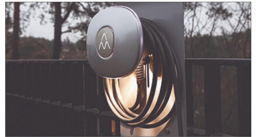
Schnell und vor allem sicher geht das Laden von E-Autos mit einer Wallbox, die das Elektroauto um bis zu zehn Stunden schneller auflädt als an öffentlichen Stationen.