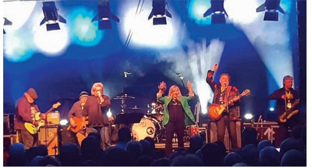
Die Rodgau Monotones spielten alle ihre Hits.