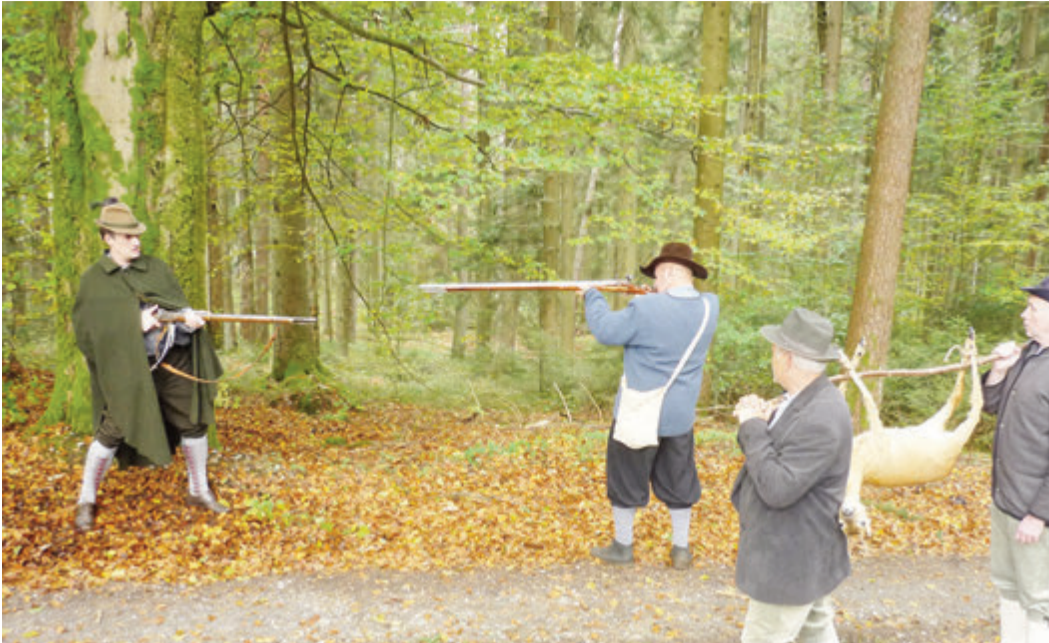
Nachstellung einer Szene, die einen Gedenkstein nach sich gezogen haben könnte.