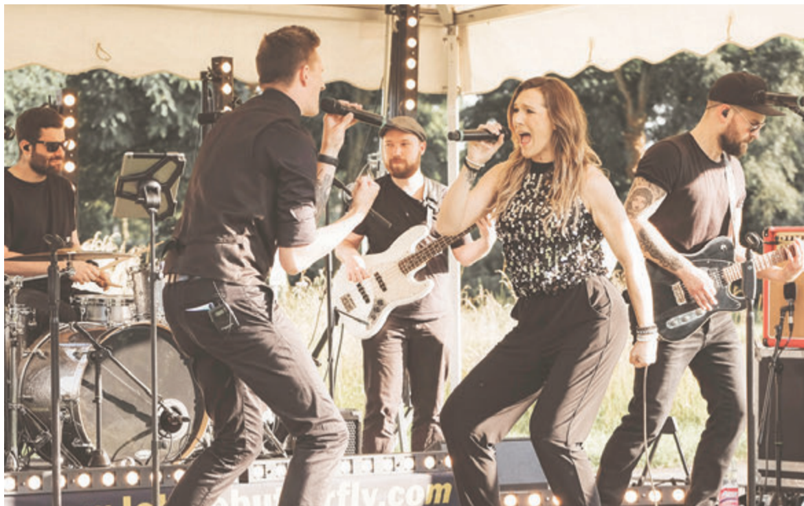
Bereits im vergangenen Jahr trat unter anderem die Band „Let the butterfly“ in Dieburg auf. Auch in diesem Jahr werden wieder namhafte Künstler erwartet.

Mossautal/ Dieburg. Die Masken sind bereits bei vielen gefallen und die Tage werden immer wärmer. Es finden wieder Volks- und andere Festivitäten statt. Somit steht der Festival-Saison 2022 auch nichts mehr im Wege. Anders sieht es bei der Online-Plattform StreamGig aus. Diese wurde 2020 coronabedingt gegründet und bot Musikern trotz Lockdown an, Konzerte per Stream abzuhalten. Die Zuschauer konnten sich über den YouTube Channel per Livestream aus dem heimischen Wohnzimmer zuschalten. Bedeutet die neu gewonnenen Freiheit für StreamGig nun das Aus? Keineswegs, das Team von StreamGig feiert in diesem Jahr bereits das zweite Jahr des Bestehens und das Format bleibt so, wie es ist – online. Mit Hilfe von Fachzeitschriften, Presse und natürlich Fans erlangte das