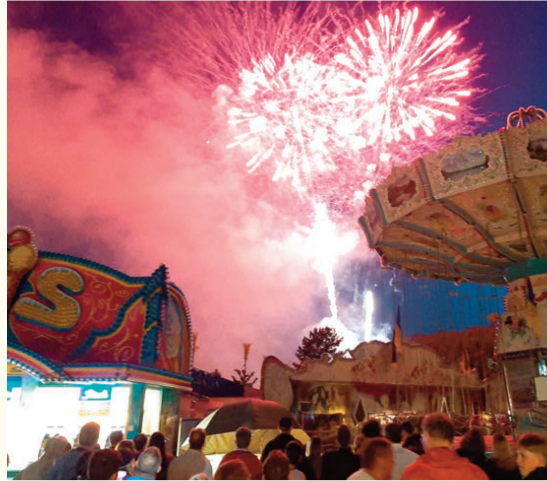
Das Großfeuerwerk zählt zu den Highlights des Rahmenprogramms beim Bienenmarkt.