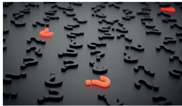
Mit Fragen fängt der Weg zur Erkenntnis an.

Odenwaldkreis. Alte Dokumente der Stadtgeschichte entziffern, Blühphasen von Straßenbäumen dokumentieren oder gemeinsam die Mobilität in der eigenen Stadt neu denken: In ganz Deutschland werden Bürgerinnen und Bürger bei Citizen-Science-Projekten zum Mitforschen eingeladen. Mit dem Wettbewerb „Auf die Plätze! Citizen Science vor Ort“, soll der Austausch von Wissenschaft und Gesellschaft auf lokaler Ebene gefördert werden. Bewerbungsschluss ist der 19. Juni 2022. Der Wettbewerb lädt engagierte Akteurinnen und Akteure aus den Bereichen Wissenschaft, Zivilgesellschaft, kommunale Verwaltung sowie Wirtschaft ein, im Verbund Citizen-Science-Aktionen zu entwickeln, um gemeinsam mit Bürgerinnen und Bürgern vor der eigenen Haustür zu forschen. Gefördert werden Ideen, die Forschung für alle erlebbar machen und Impulse für eine nachhaltige Zusammenarbeit zwischen Wissenschaft und Zivilgesellschaft setzen. „Citizen Science ist Treiber, um mit Bürgerinnen und Bürgern gemeinsam die kleinen und großen