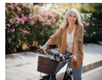
Bewegung macht nicht nur Spaß, sie stärkt auch die Knochen.

Circa 6,3 Millionen Menschen – zu meist Frauen, aber auch rund 1,1 Millionen Männer – sind von Osteoporose betroffen 1 . Die Erkrankung wird oft erst erkannt, wenn es aus einem geringfügigen Anlass zu einem Knochenbruch kommt. Ist die Diagnose gestellt, wird nur jeder Fünfte angemessen behandelt 1 . Eine aktive Lebensweise und eine kalziumreiche Ernährung tragen zudem sowohl dazu bei, einer Osteoporose vorzubeugen als auch eine Behandlung der Erkrankung zu unterstützen.