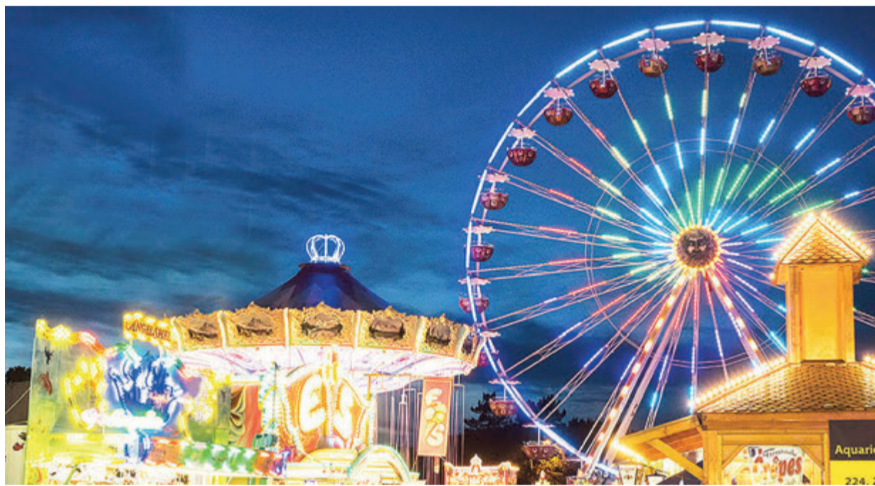
So schön war es, so schön soll es wieder werden – der Bienenmarkt vor der Corona-Pandemie

Michelstadt. Nach zwei Jahren Verzicht ist es dieses Jahr Anfang Juni, am Freitag vor Pfingstsonntag wieder so weit: Der Bienenmarkt in Michelstadt wird wieder aufgebaut, und schon bald können die Besucher wieder das bunte Lichtermeer bewundern und einen Abend zwischen den Ständen und Attraktionen genießen. Der Bienenmarkt ist das zweitgrößte Volksfest der Region und dauert zehn Tage, so dass genug Zeit ist, einen ausgiebigen Besuch mit der ganzen Familie