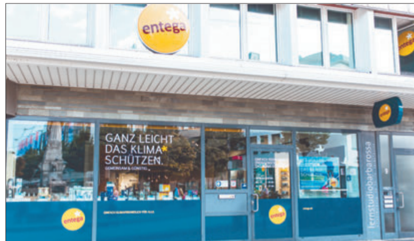
Im ENTEGA Point Darmstadt können sich Eigentümer von Wohngebäuden fortan von unabhängigen und zertifizierten Experten der Effizienz:Klasse GmbH beraten lassen.

Erweitertes Leistungsspektrum zu energetischer Gebäudesanierung im ENTEGA Point Darmstadt