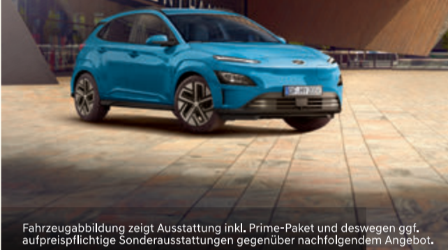
Fahrzeugabbildung zeigt Ausstattung inkl. Prime-Paket und deswegen ggf. aufpreispflichtige Sonderausstattungen gegenüber nachfolgendem Angebot.

Hyundai garantiert die Umweltprämie! Jetzt Modell mit alternativem Antrieb bestellen!