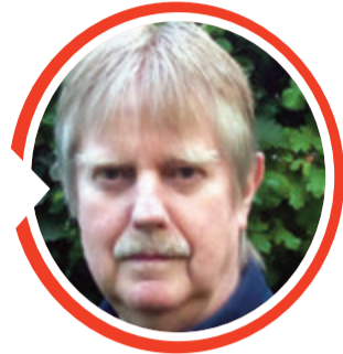
von Dr. Detlef Eichberg

☞ Guggsdu auch hier: www.detti-lama-apolue.de