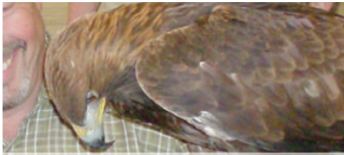
Das Eintracht-Maskottchen Attila Seite 12