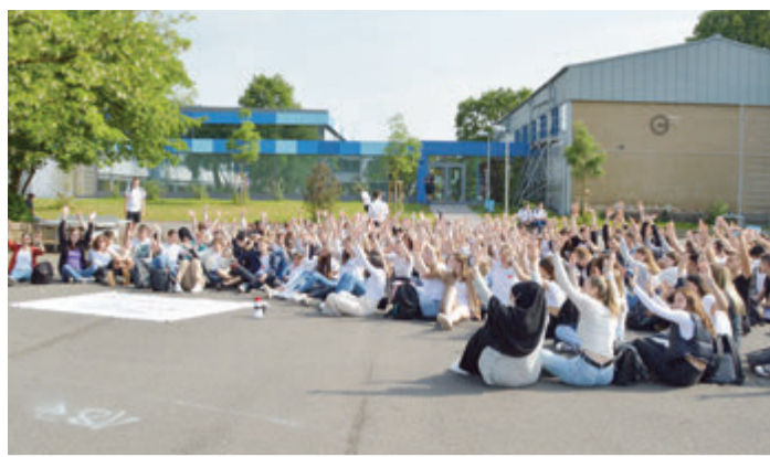
Schüler der Ernst-Göbel-Schule verharren in einem friedlichen Sitzstreik auf dem Schulhof.