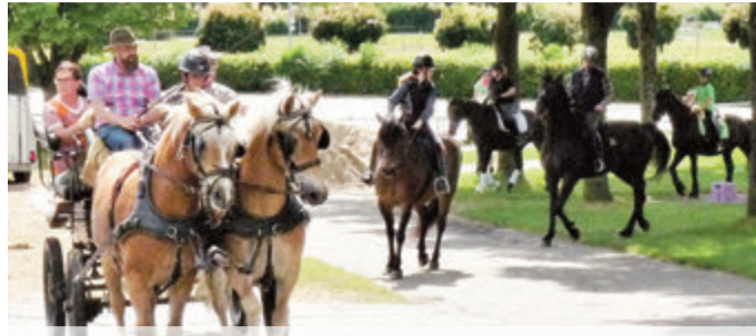
Unterwegs hoch zu Ross