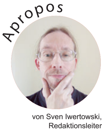
von Sven Iwertowski, Redaktionsleiter