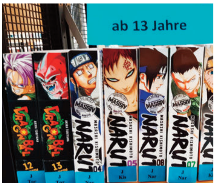
Für Mangafans wurde beim Einkauf gesorgt.