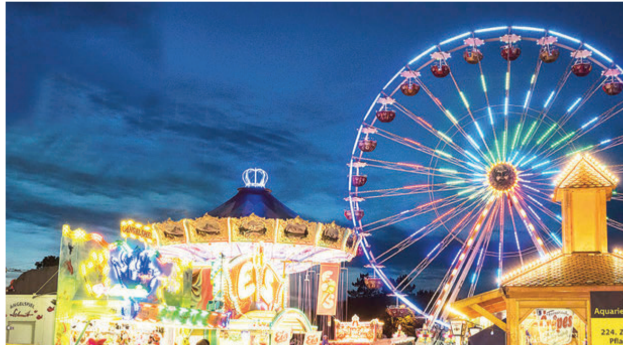
So schön war es, so schön soll es wieder werden – der Bienenmarkt vor der Corona-Pandemie.

Bienenmarkt bringt zehn Tage Freude nach Michelstadt