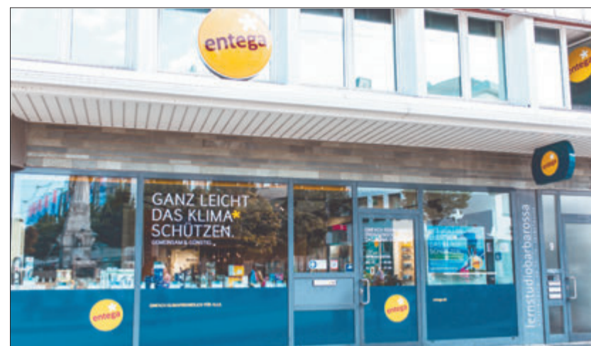
Im ENTEGA Point Darmstadt können sich Eigentümer von Wohngebäuden fortan von unabhängigen und zertifizierten Experten der Effizienz:Klasse GmbH beraten lassen.

Erweitertes Leistungsspektrum zu energetischer Gebäudesanierung im ENTEGA Point Darmstadt