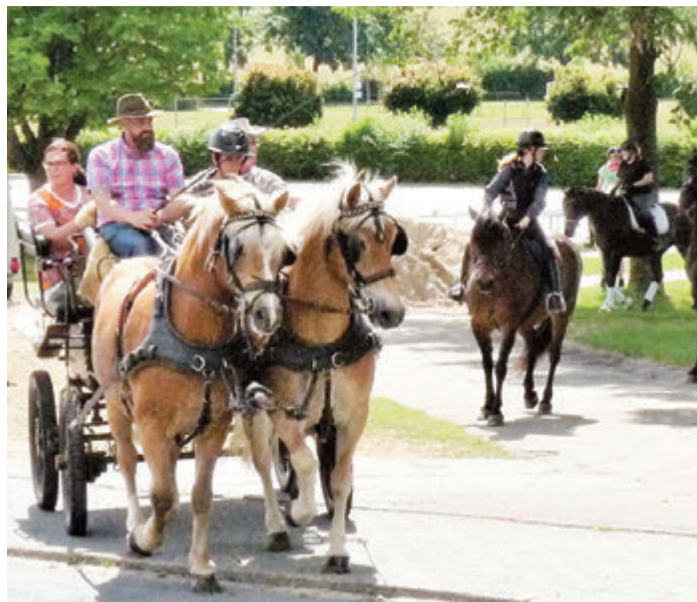
Kutschfahrt oder Hoch zu Roß – zum Ausritt sind alle Stile, alle Pferderassen willkommen.

Oberzent-Beerfelden. An Fronfeldener Reit- und Fahrverein leichnam (16. Juni), lädt der Beer-