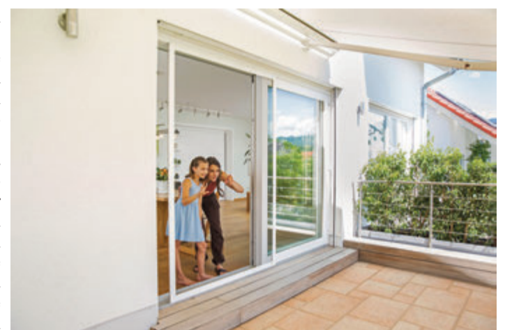
Große Öffnungen bieten viel Wohnkomfort - lassen aber auch Krabblers und Summer ins Zuhause eindringen. Ein Insektenschutz in Form eines Schiebeelements sorgt für Abhilfe.

Großzügige Glasflächen prägen die heutige Wohnarchitektur. Breite Schiebetüren zur Terrasse etwa holen viel Tageslicht und Frischluft in den Wohnbereich und lassen Innen und Außen fließend ineinander übergehen. Das große Maß an Offenheit und Transparenz lockt aber auch Spinnen, Mücken, Ameisen und mehr an – ungebetener Besuch, auf den man im Haus getrost verzichten könnte. Deshalb permanent alle Fenster und Türen geschlossen zu lassen, kann allerdings keine Lösung sein. Stattdessen halten nahezu unsichtbare Insektenschutzgewebe die Krabblers und Summer auf sanfte Weise fern. Die Systeme gibt es auch für extra breite und große Türöffnungen. Wenn Insektenschutzgewebe in