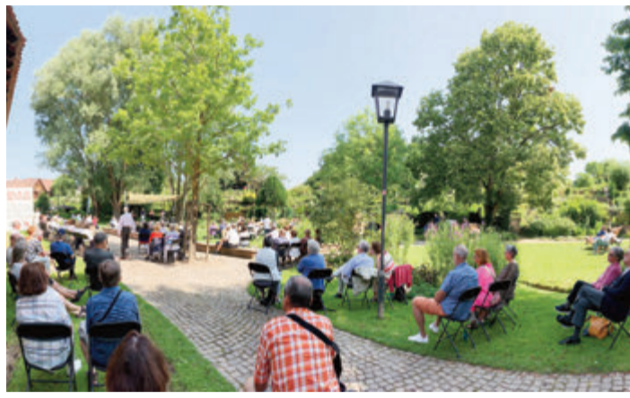
Eine beispielhafte Matinee.