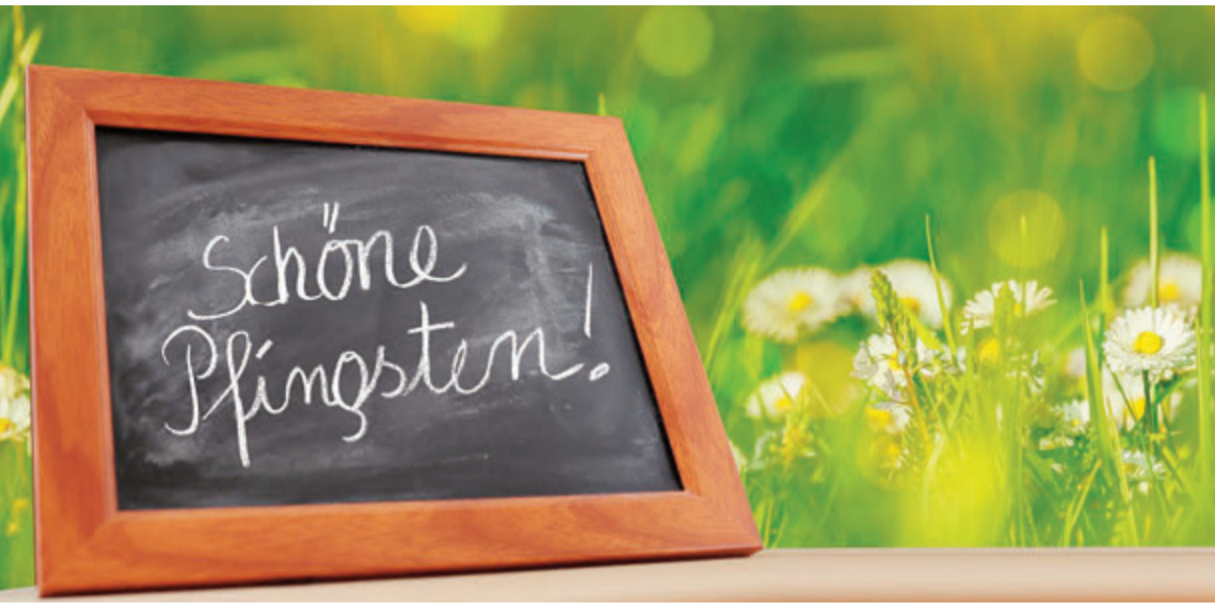
Wir wünschen allen Leserinnen und Lesern schöne Pfingstfeiertage und ein gutes langes Wochenende.