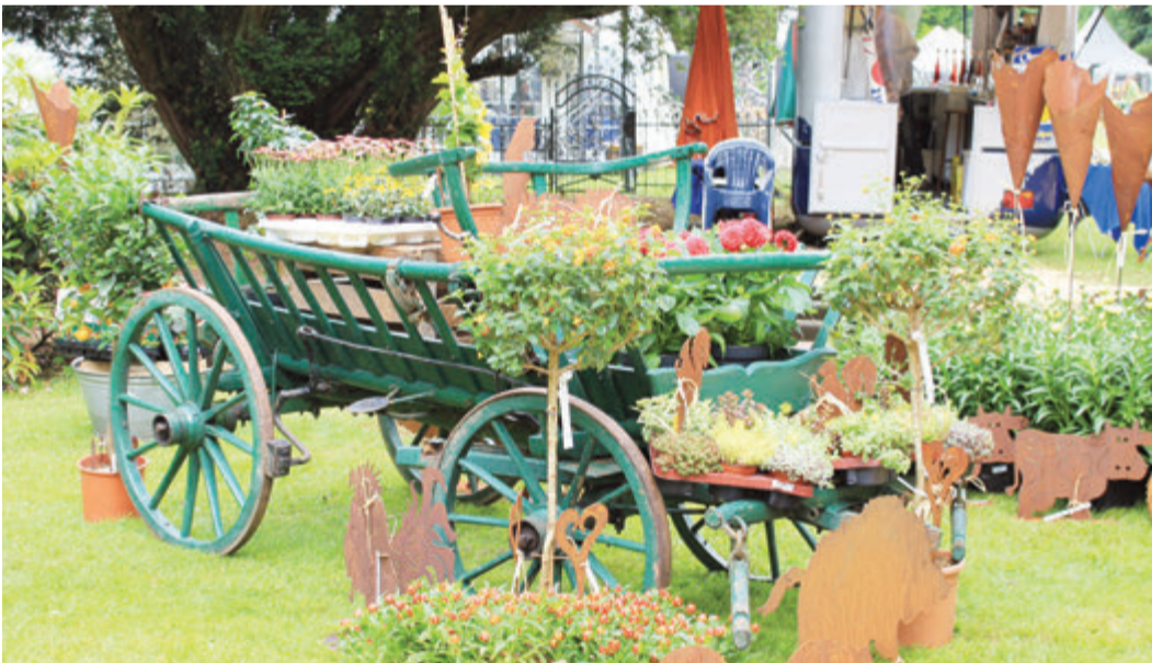
Nur ein Beispiel für viele Möglichkeiten ästhetischer Garteingestaltung

Michelstadt. Im vom Gartenbaukünstler Ludwig von Skell geplanten Englischen Garten zu Eulbach ist nach zweijähriger Zwangspause wieder Country-Fair vom 16. bis 19. Juni. Auch in diesem Jahr werden annähernd 200 Aussteller vertreten sein. Die historisch und gärtnerisch einzigartige Garten- und Parkanlage bildet einen besonders sehenswerten Rahmen für die Ausstellung, die den Besuchern „Schönes, Stilvolles, Nützliches, Antikes, Wertvolles, Blühendes,