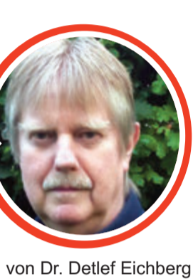
von Dr. Detlef Eichberg