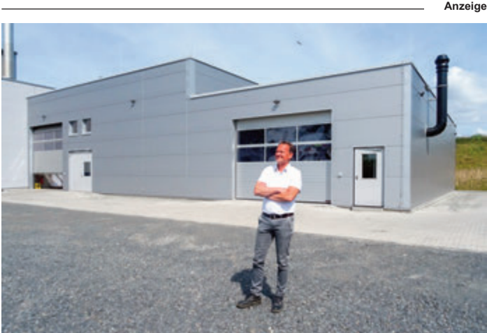
Ein Blick von außen auf die Produktionsanlage.