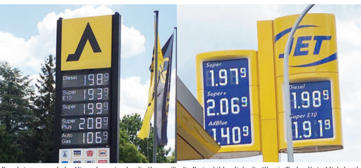
Es scheint nur noch der Himmel zu sein, der die Grenze für die Preise bildet; links die Classic Tankstelle in Michelstadt, rechts die Jet Tankstelle in Reinheim.

Odenwaldkreis. Seit 1. Juni ist der langersehnte Tankrabatt endlich da, aber die Spritpreise kratzen wieder an der Zwei-Euro-Marke. Der erhoffte Erfolg entpuppt sich also zunehmend zum Desaster. Die wenigen Anbieter für Benzin und Diesel besitzen eine große Marktmacht. Daher ist es möglich, dass der Tankrabatt nicht an den Endverbraucher weitergegeben wird und die Konzerne die Steuersenkung für sich behalten. Laut Homepage des Bundeskartellamtes seien die Mineralölkonzerne nicht verpflichtet, den Rabatt auf Kraftstoffe weiterzugeben. „Es gibt keinen Tankrabatt mehr. Ich bin der Meinung, das liegt an den Ölkonzern-