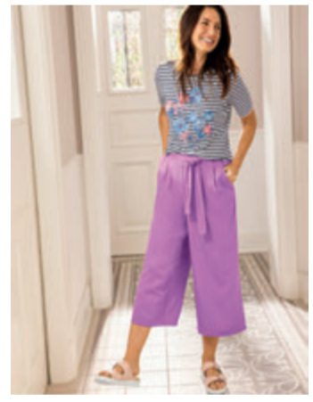
Avena GmbH & Co. KG, Rheingrafenstraße 3, 55543 Bad Kreuznach

Der Sommer lockt mit spannenden Reisezielen bei herrlich warmen Temperaturen. Egal, ob es nach Syllt oder Italien geht – mit diesem pflegeleichten Outfit von Avena macht Frau bei jeder Urlaubsaktivität eine gute Figur!