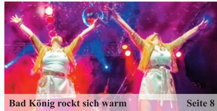
Bad König rockt sich warm Seite 8

Ein Lob dem Apfel: Apfelweinfest in Beerfurth Seite 7