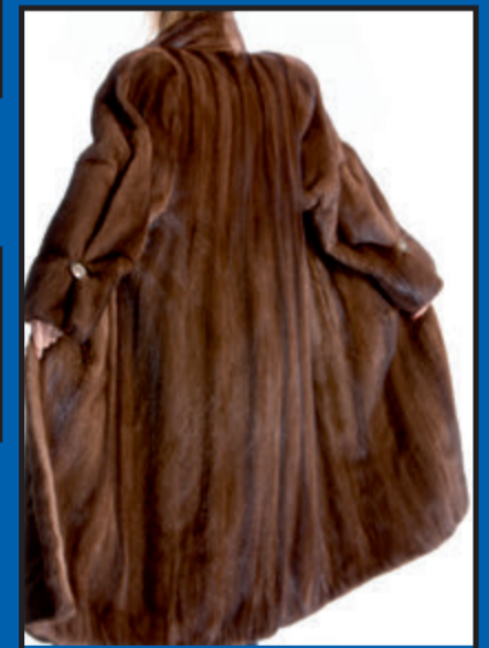
Verbindung Pelz mit Gold*

Wir zahlen bis zu 5000,- € für Ihren Pelz!