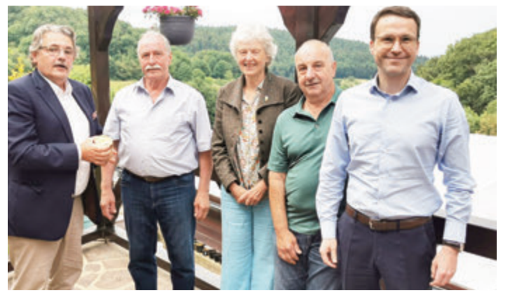
Über rund 2300 Euro kann sich der Imkerverein Modautal-Fischbachtal e.V. freuen.