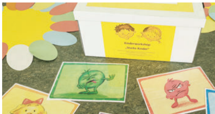
Jede Kita, die an dem Präventions-Workshop teilnimmt, bekommt diese Materialkiste.

Odenwaldkreis. Zur Prävention sexualisierter Gewalt an Kindern hat das Jugendamt des Odenwaldkreises einen Workshop für Kinder in Kindertagesstätten entwickelt. Gedacht ist der Workshop für die Kinder im letzten Kindergartenjahr. Carmen Mundelius und Gesa Heimann bieten ihn in jeder Kindertagesstätte einmal an, schulen jedoch die Erzieherinnen und Erzieher vor und während des Workshops so, dass sie das Angebot für die folgenden Jahrgänge selbst durchführen können.