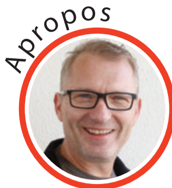
von Volker Zaborowski, Chefredakteur

den Markt analysieren können, welche Rechtsform sie wählen sollten, welcher Kapitalbedarf und welche Versicherungen notwendig sind. Die Platzzahl ist auf sieben Teilnehmerinnen beschränkt. Vorgesehen sind fünf Vormittage im virtuellen Raum (4. Juli/ 5. Juli/ 8. Juli/ 11. Juli/ 12. Juli, jeweils von 9.30 bis 11 Uhr). Des Weiteren sind ca. sechs Stunden als Selbstlern- und Recherchephase einzuplanen. Das Angebot ist kostenfrei. Anmeldung unter 06078-72377 oder per E-Mail an info@zibb-umstadt.de red