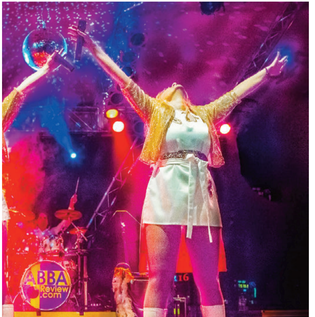
ABBA Review Tribute Show in großem Glanz – nur eines der Highlights.

Vita. Zuletzt geht es nach der Siegerehrung und Nachzielverpflegung noch in „La Bastille“, nur etwa 150 Meter vom Kellereihof entfernt. Hier startet die After-Race Party mit der Live-Band „The Kern Brothers“. Für die Schülerinnen und Schüler der 1. -7. Klasse geht es auf einem 400m langen Rundkurs für 20 Minuten darum, im Klassenverband so viele Runden wie möglich zu absolvieren. Sponsoren sind die Stadt Michelstadt, Treffpunkt Thierolf, Hüttenthal, Erbtech, Mertins, Sport Weber und BARMER, um das Startgeld auf vier Euro pro Kind zu halten. Im Startgeld enthalten ist eine Nachzielverpflegung sowie ein eigenes T-Shirt. Die Anmeldung ist noch bis zum 19. Juni unter http://www.team-marathon-michelstadt.de/ möglich. Bei Fragen steht die Tel.: 06151-3525729 zur Verfügung. red